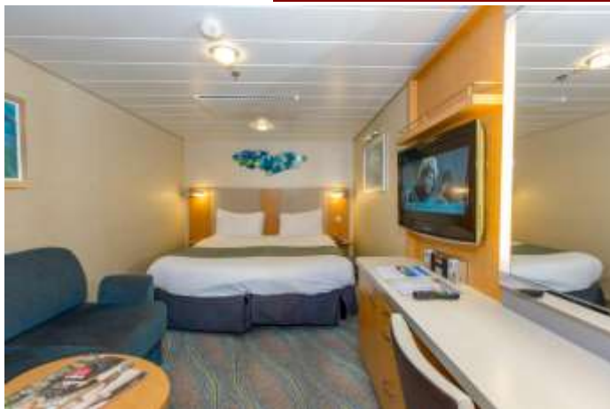
ห้องไม่มีหน้าต่าง Interior Stateroom