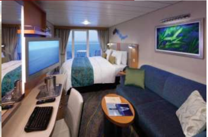
ห้องมีระเบียง Balcony Stateroom

สนใจห้องพักรบนเรือประเภทอื่นๆ นอกเหนือจากที่ระบุ โปรดสอบถามค่าบริการเพิ่มเติมจากเจ้าหน้าที่