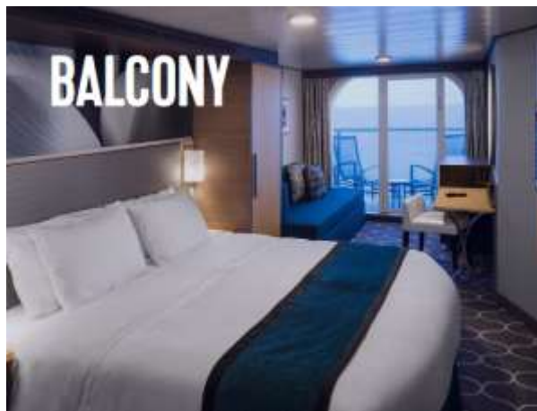
ห้องมีระเบียง Balcony Stateroom