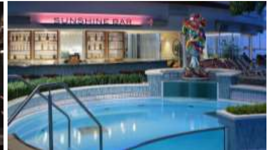
Sun shine Bar