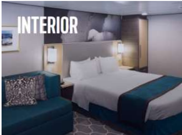
ห้องไม่มีหน้าต่าง Interior Stateroom

สนใจห้องพักบนเรือประเภทอื่นๆ นอกเหนือจากที่ระบุ โปรดสอบถามค่าบริการเพิ่มเติมจากเจ้าหน้าที่ประเภทห้องพักบนเรือสำราญ