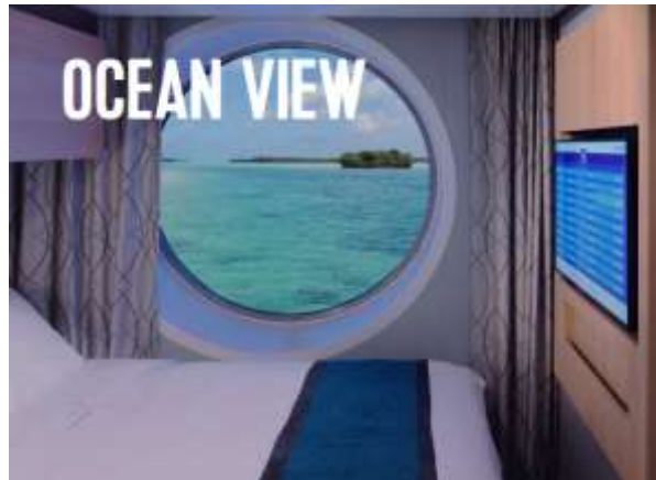
ห้องมีหน้าต่าง Ocean View