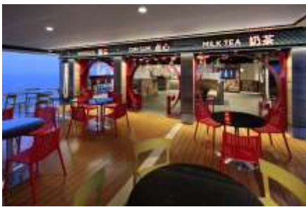
Kung Fu Panda