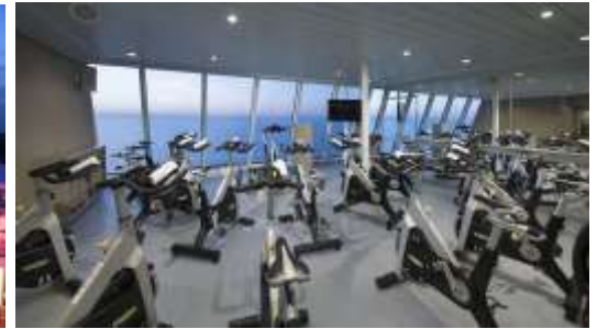
Spin Class Fitness