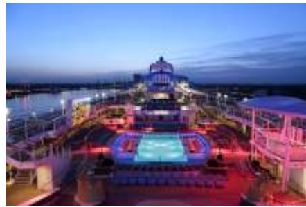
Pool Deck Night