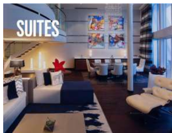
ห้องสวีท Suite