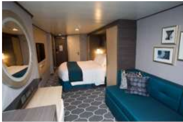
Interior ห้องพักไม่มีหน้าต่าง