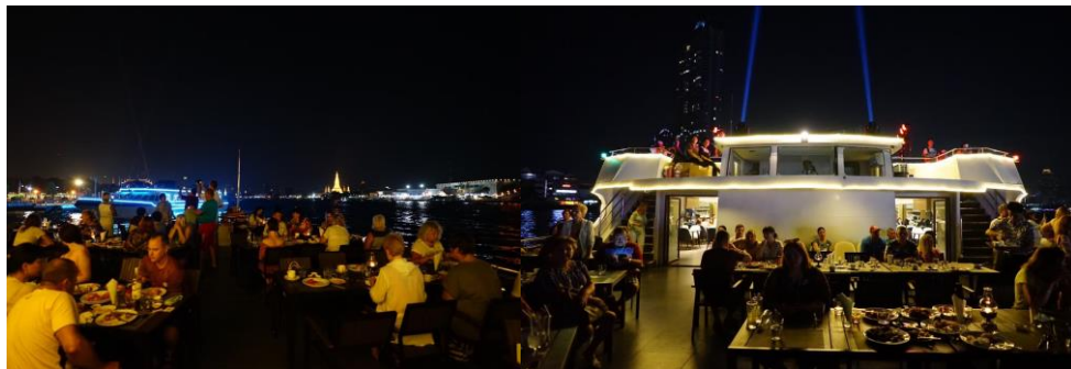
บรรยากาศหัวเรือชั้น 2 และดาดฟ้าเรือ ชั้น 3