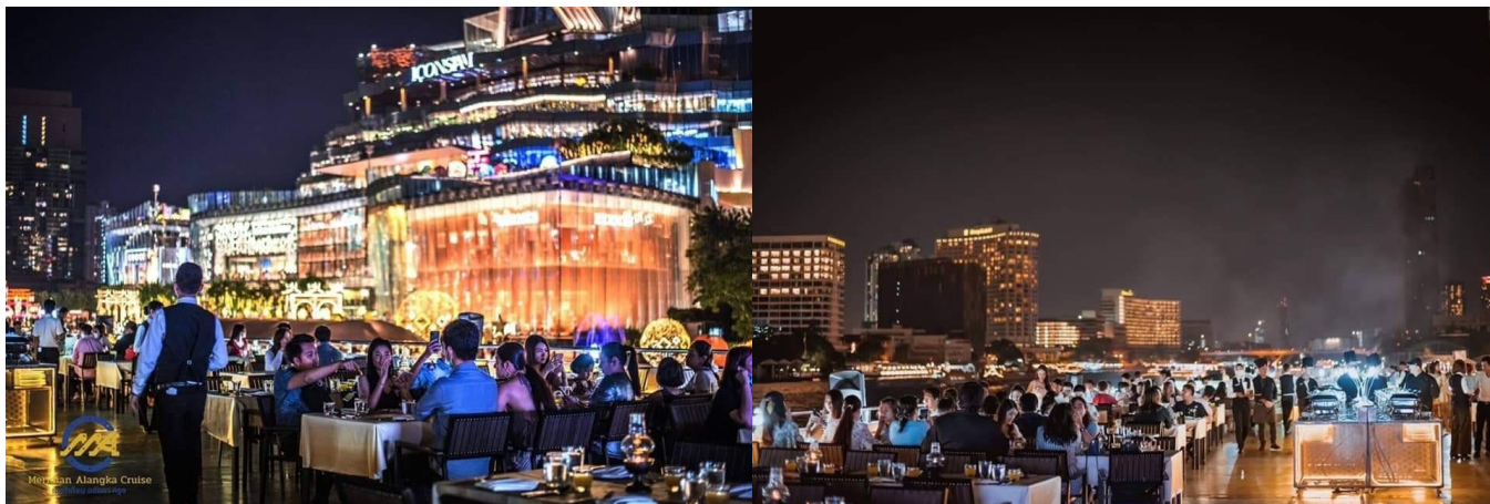
บรรยากาศโซนกลาง ดาดฟ้า