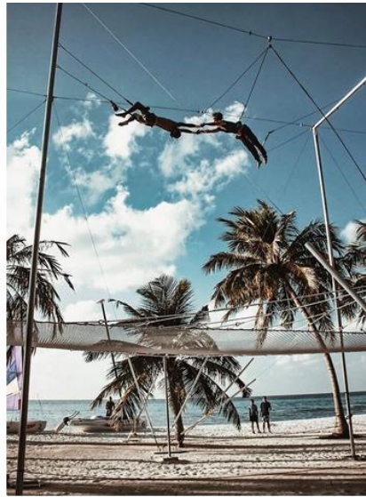
Flying Trapeze School