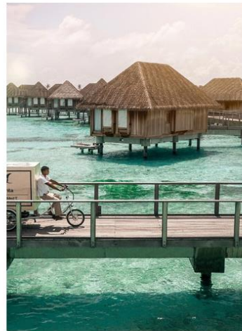
Room Service Tricycle