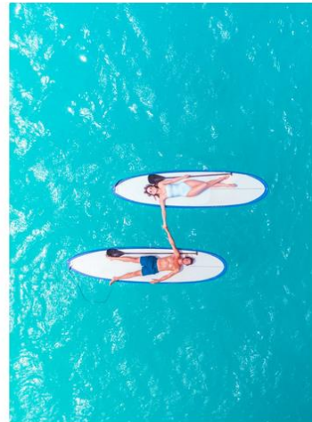
Stand up paddle boarding