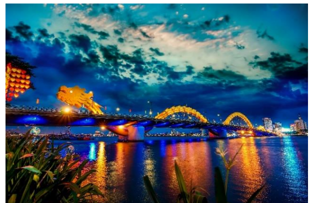
GOLDEN ROSE DANANG หรือเทียบเท่า

วันที่สาม เมืองดานัง - เขาบานาฮิลล์+นั่งกระเช้ายาวที่สุดในโลก (หมู่บ้านฝรั่งเศส+โรงไวน์ Debay Wine Cellar+ สะพานทอง+สวนดอกไม้+สวนสนุก) พักบนบานาฮิลล์