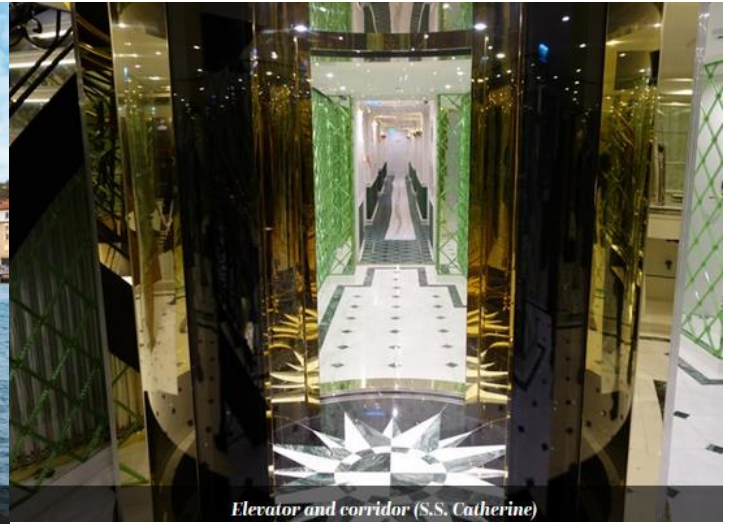
Elevator and corridor (S.S. Catherine)