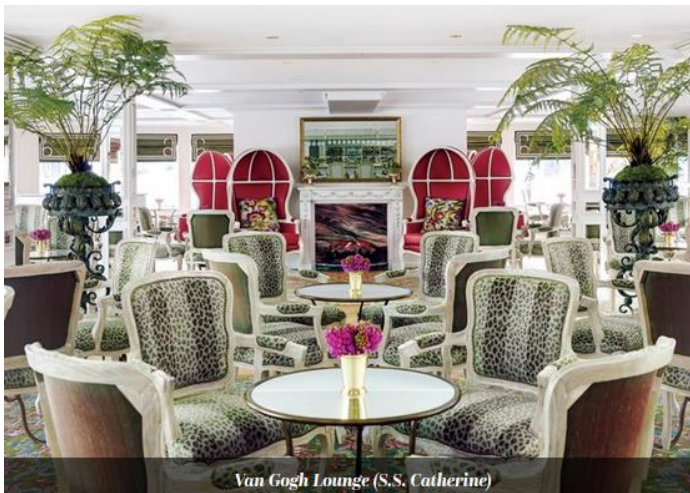
Van Gogh Lounge (S.S. Catherine)