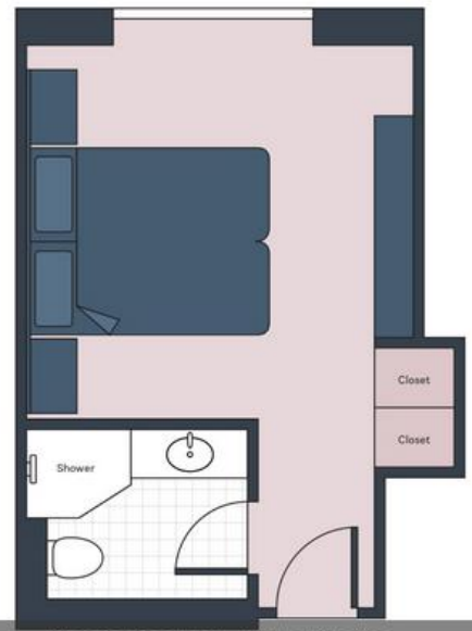
Classic Floorplan - S.S. Catherine