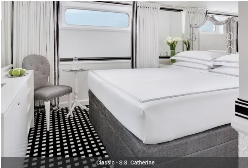
Classic - S.S. Catherine