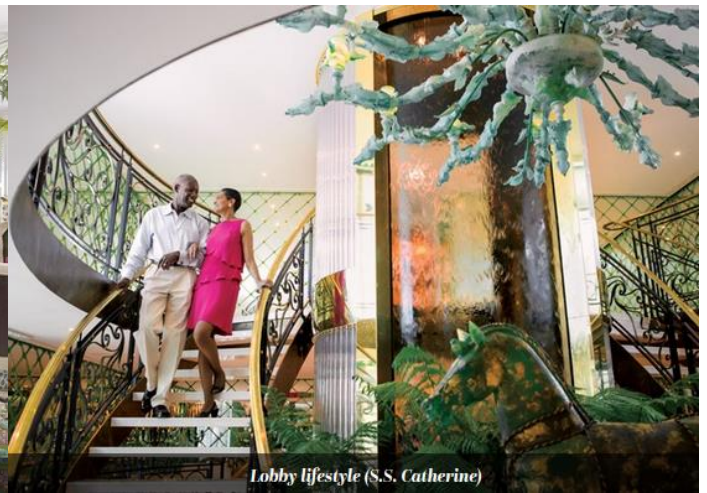
Lobby lifestyle (S.S. Catherine)