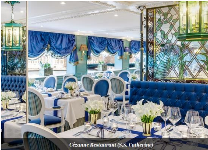
Cézanne Restaurant (S.S. Catherine)