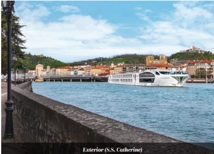
Exterior (S.S. Catherine)