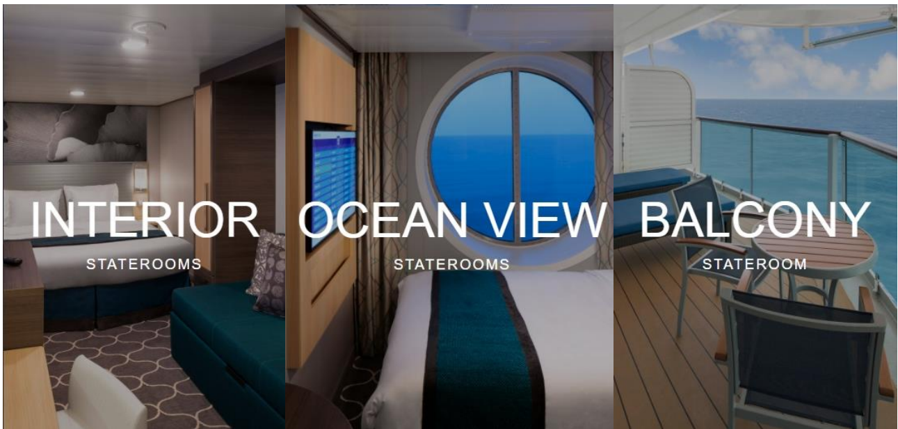
ห้องพักแบบ Inside