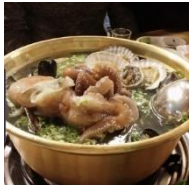
สาหร่าย หัวไชเท้า

พาท่านลิ้มรสเมนูพิเศษ ซุ๊ปไก่ทะเลสวรรค์ (มื้อที่ 5) ที่ผสมผสานความเป็นท้องทะเลของเกาะเชจู เข้ากับเรื่องสุขภาพที่แข็งแรงนั่นก็คือซุ๊ปไก่นั่นเอง เมนูนี้จึงเปรียบดั่งเมนูจากสวรรค์เลยทีเดียว ส่วนประกอบหลักๆ จะเป็นไก่ที่ต้มด้วยสมุนไพรจีนเปื่อย และเพิ่มซีฟู้ดตามฤดูกาลเข้าไป ทำให้น้ำซุ๊ปอร่อย หวาน กลมกล่อมไม่เหมือนใคร เสิร์ฟท่านพร้อมข้าวสวยร้อนๆ และเครื่องเคียงต่างๆ เช่นกิมจิ