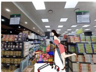
ตามเงื่อนไซของร้านด้วย

จากนั้นพาท่านเดินทางสู่ Supermarket หรือที่นักท่องเที่ยวเรียกกันว่า "ร้านละลายเงินวอน" ที่นี่มีขนม ของฝาก ของ