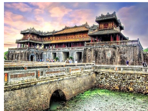
ที่ทำการของพระองค์กับ เสนาธิการ

รับประทานอาหารเช้าที่ โรงแรม (3) จากนั้นนำท่านชม พระราชวังไดโน้ย พระราชวังโบราณแห่งสุดท้ายของเวียดนาม UNESCO ประกาศให้ เป็นแหล่งมรดกโลก เป็นที่ประทับ ที่ทำการของระบบพระราชวงศ์สุดท้ายของประเทศเวียดนามคือพระราชวังเหียนมีพระองค์ทั้งหมด 13 องค์ที่ได้ขึ้นมาถือครองราชย์นับตั้งแต่ ค.ศ. 1802 จนถึง ค.ศ. 1945 มีสถาปัตยกรรมที่สวยงามใหญ่โต อลังการเป็นอย่างยิ่ง ท่านจะได้ชมครบทั้งหมด 3 ส่วนของพระราชวังได้แก่ กำแพงรอบนอกป้องกันตัวพระราชวังที่เรียกว่า “กึ่งถัน” และแม่ทับ ท้องพระโรงที่เรียกว่านครจักพรรค์ “ไถหว่า” และส่วนที่สำคัญมากที่สุดของพระราชวังคือพระราชวังต้องห้าม เป็นที่ประทับของพระองค์ พระราชินี นางสนมและกลุ่มคนรับใช้เป็นชั้นที่ ที่เรียกกันว่า ”ตือกัมถัน” จากนั้นนำท่านเดินทางเข้าสู่ริมอ่าวลิ่งโก