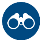
Sightseeing with Local Guides