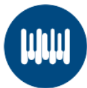
Nightly Piano Music