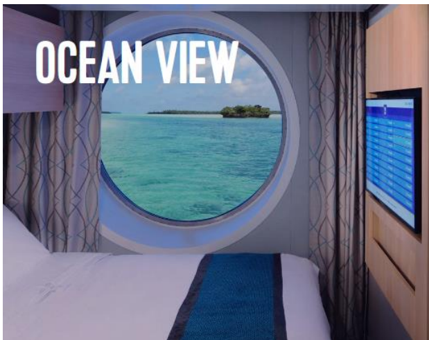
ห้องพักแบบมีหน้าต่าง Ocean View