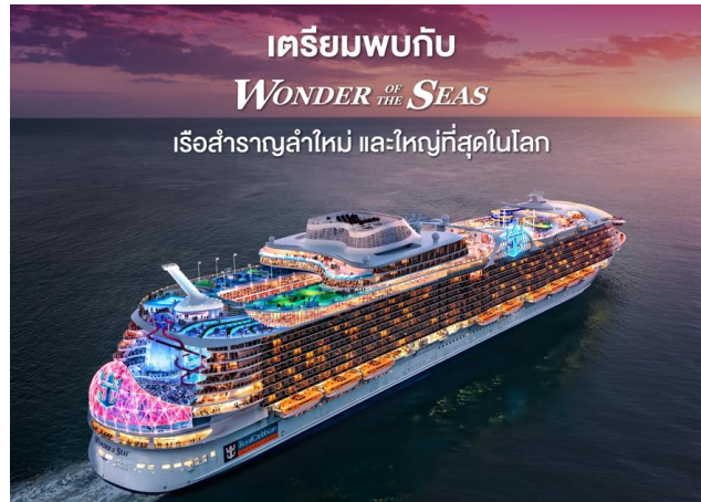
เตรียมพบกับ WONDER OF THE SEAS เรือสำราญลำใหม่ และใหญ่ที่สุดในโลก

การเดินทางเข้าฝรั่งเศส : ต้องแสดงเอกสารการได้รับวัคซีนตามท้องครยายุโรปรับรอง คือ Pfizer, Moderna, Astrazeneca, Astrazeneca Thai, Covishield, J&J ครบโดส และแสดงผลตรวจโควิด-19 ด้วยวิธี RT-PCR เป็นลบ ไม่เกิน 72 ชั่วโมง ก่อนเดินทาง หรือ Antigen Test ไม่เกิน 48 ชั่วโมง ก่อนเดินทาง จะไม่ต้องตรวจหาเชื้ออีกครั้ง เมื่อเดินทางถึง และไม่ต้องกักตัว