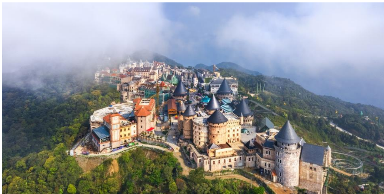
อาณานิคมของฝรั่งเศส

นำท่านอิสระที่ สวนสนุกแฟนตาซี พาร์ค (ราคาทัวร์รวมค่าเครื่องเล่นภายในสวนสนุกทุกเครื่องเล่น ยกเว้น พิพิธภัณฑน์หุ่นขี้ผึ้ง และเครื่องเล่นที่ใช้ระบบหยอดเหรียญ) ซึ่งมีเครื่องเล่นหลากหลายรูปแบบ เช่น ทำความผจญภัยของหนัง 4D ระทึกขวัญกับบ้านผีสิง เกมสึสนุกๆ เครื่องเล่นเบาๆ รถไฟเหาะ หรือจะเลือกซื้อป๊อปของที่ระลึกของสวนสนุก หลังจากนั้นเดินเที่ยวชมโซนสวนดอกไม้ LE JARDIN D'AMOUR สวนดอกไม้สไตล์ฝรั่งเศส ที่มีดอกไม้หลากหลายพันธุ์ถูกจัดเป็นสัดส่วนอย่างสวยงาม ที่มีมุมถ่ายรูปน่ารักๆ ให้ท่านได้เลือกถ่ายได้ตามใจชอบ หลังจากนั้นท่าน นั่งรถรางโบราณขึ้นเขา เพื่อเข้าชมอุโมงค์เก็บไวน์ บนยอดเขานาฮิสล์ เป็นสถานที่เก็บไวน์ที่มีความลึกลงไปถึง 100 เมตร ภายในอุโมงค์ จะมีอุณหภูมิอยู่ที่ 16 ถึง 20 องศา ว่ากันว่าเป็นอุณหภูมิที่ดีที่สุดสำหรับการบ่มไวน์ สถานที่แห่งนี้ถูกเรียกว่า “DEBAY WINE CELLAR” ออกแบบโดยสถาปนิกชาวฝรั่งเศส และสร้างขึ้นตั้งแต่ปี 1923 สมัยล่า