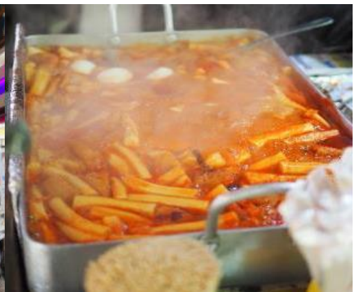
คำ อธิระในการรับประทานอาหาร เพื่อความสะดวกในการท่องเที่ยว