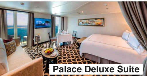
Palace Deluxe Suite