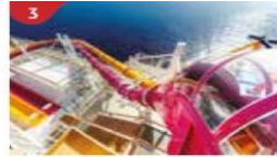
Waterslide Park Get drenched in fun on one of our six different waterslides.