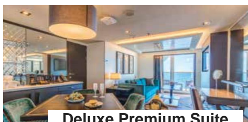
Deluxe Premium Suite