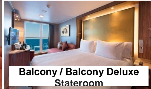
Balcony / Balcony Deluxe Stateroom