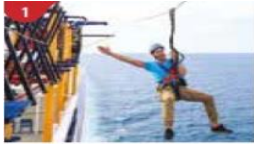
Ropes Course & Zipline Feel the thrill of gliding above the ocean on a 35-metre zipline.