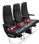
ที่นั่งมาตรฐาน

ที่นั่งบริเวณด้านหน้าของเครื่องบินและแถวประตูทางออกฉุกเฉิน มี Hot Seat มีความกว้างระหว่างแถว 29 นิ้ว และมีขนาดกว้าง 16-17 นิ้ว คุณสามารถนั่งแบบสบายได้อย่างเต็มที่ด้วยที่วางขนาด 20.3 นิ้ว สำหรับที่นั่งในแถวแรกและแถวประตูทางออกฉุกเฉิน นอกจากนี้ คุณ ยังได้สิทธิ์ขึ้นเครื่องก่อนใครอีกด้วย