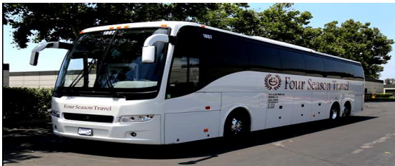
20-35 ท่าน ใช้รถปรับอากาศขนาด 45 ที่นั่ง