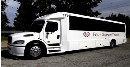
15-19 ท่าน ใช้รถปรับอากาศขนาด 25 ที่นั่ง