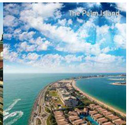
The Palm Island

นำท่านชมชายหาด JUMEIRAH BEACH ซึ่งเป็นชายหาดตากอากาศที่สวยงามยอดนิยมของดูไบ