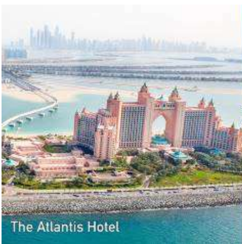
The Atlantis Hotel

นำท่าน นั่งรถไฟ MONORAIL > เดินทางสู่โครงการเดอะปาล์ม THE PALM ซึ่งเป็นโครงการที่อลังการ สุดยอดเยี่ยม ปร เจคส์โดยการถมทะเล ให้เป็นเกาะเทียมสร้างเป็นรูปต้นปาล์ม 3 เกาะ บนเกาะมีที่พักโรงแรม รีสอร์ท อพาร์ทเม้น ร้านค้า ภัตตาคาร รวมทั้งสำนักงาน ต่างๆนับว่าเป็นสิ่งมหัศจรรย์อันดับ 8 ของโลก