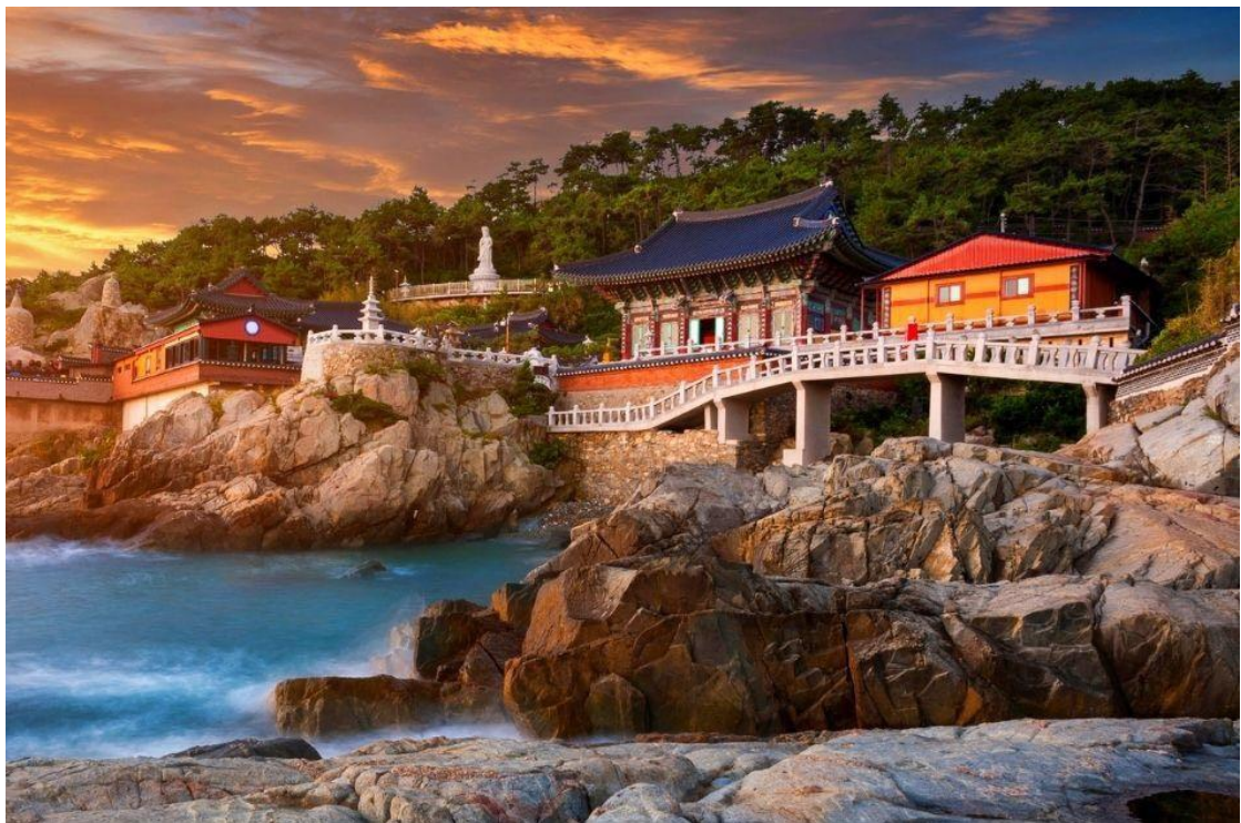
พาทุกท่านเดินทางสู่เมืองปูซาน วัดแฮดงยงกุงซา ตั้งอยู่บนชายฝั่งตะวันออกเฉียงเหนือของเมืองปูซานเป็นวัดที่สร้างบนเหล่าโขดหินริมชายหาดที่แตกต่างไปจากวัดส่วนใหญ่ซึ่งมักจะสร้างอยู่ตามเชิงเขาวัดแห่งนี้ก่อตั้งโดยพระผู้ยิ่งใหญ่ซึ่งมีนามว่าพระนางอชูดซาซึ่งเป็นที่ปรึกษาของกษัตริย์คังมินวังแห่งโครยอเมื่อทุกท่านเดินทางเข้าสู่วัดแห่งนี้จากประตูซุ่มมังกกรสีทองอร่ามเดินผ่านอุโมงค์ขนาดเล็กไปสู่บันไดหิน 108 ขั้นและโคมไฟหินซึ่งเป็นจุดสำหรับชมวิวและความงดงามของท้องทะเลสีฟ้าครามก่อนจะเดินต่อไปสู่บริเวณซึ่งเป็นที่ประดิษฐาน