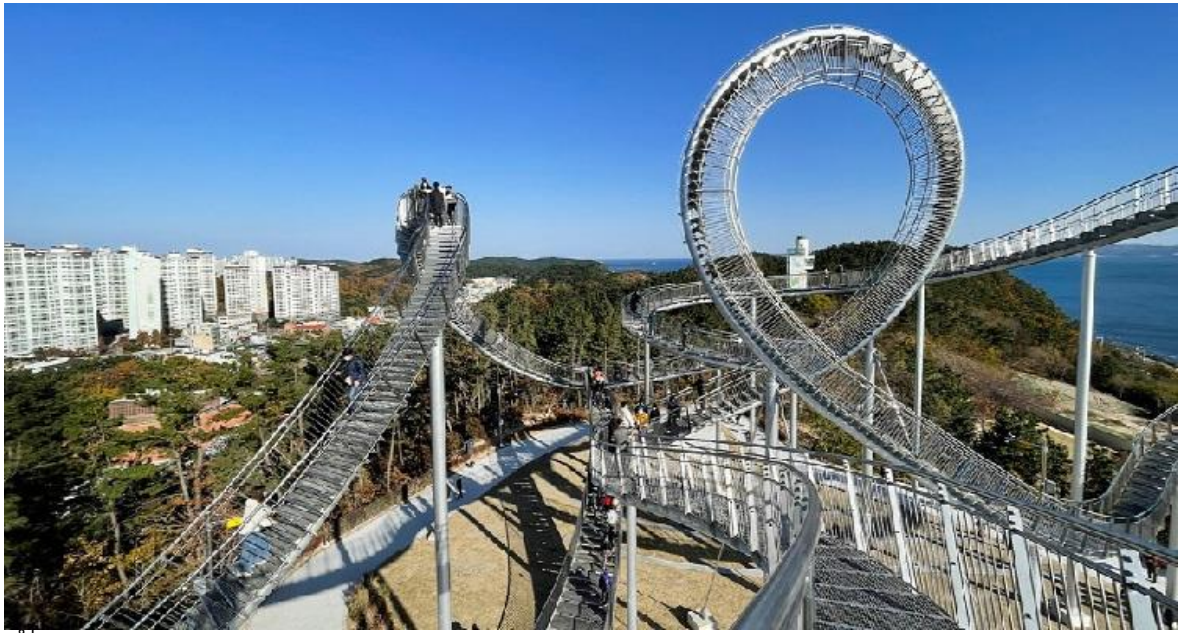
นำท่านเดินทางไปยัง “โพฮังสเปซวอล์ก” สกายวอร์ค ที่ใหญ่ที่สุดในประเทศแลนต์มาร์กใหม่ของเมืองโพฮัง ตั้งอยู่ในสวนฮวานโฮ