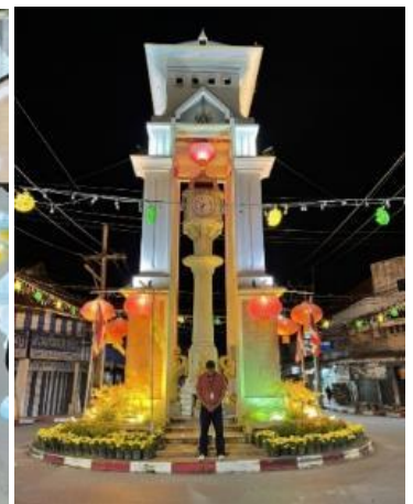
เย็น อิสระอาหารเย็นตามอัธยาศัย

☞ ที่พัก โรงแรม คาเฟ่ เบตง หรือเทียบเท่า