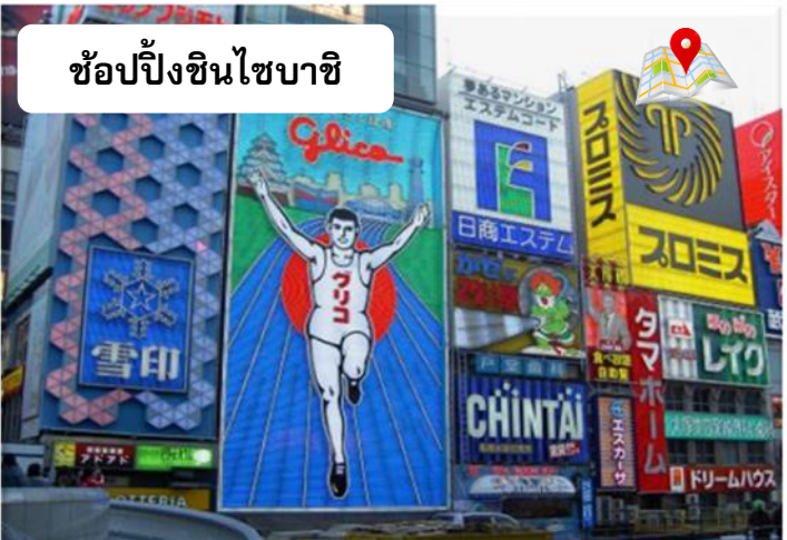
ช้อปปิ้งชินไซบาชิ

เพื่อไม่เป็นการรบกวนเวลาในการช้อปปิ้งของท่าน จึงให้ท่านอิสระในการเลือกรับประทานอาหารได้ตามอัธยาศัย