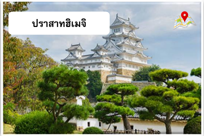
ปราสาทฮิเมจิ

จากนั้นเที่ยวชม ปราสาทฮิเมจิ เป็นปราสาทญี่ปุ่น ตั้งอยู่ในเมืองฮิเมจิ จังหวัดเฮียวโงะ เป็นสิ่งก่อสร้างที่เก่าแก่ที่สุดแห่งหนึ่งที่เหลือรอดมาจากการทิ้งระเบิดในช่วงสงครามโลกครั้งที่สองและแผ่นดินไหวครั้งใหญ่ฮันชิง พ.ศ. 2538 ปราสาทฮิเมจิได้รับการยกย่องจากยูเนสโกให้เป็นมรดกโลกและสมบัติประจำชาติญี่ปุ่นเมื่อเดือนธันวาคม พ.ศ. 2536 เป็น 1 ใน 3 ปราสาทที่มีความเก่าแก่ และงดงามที่สุดของประเทศ