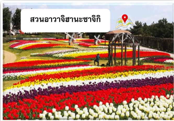
สวนอวาริจิฮานะซาจิกิ

นำท่านเที่ยวชม สวน อวาริจิ ฮานะซาจิกิ สถานที่ท่องเที่ยวชื่อดังที่มีดอกไม้งามบานกว้างใหญ่บนทุ่งหญ้าที่บนเนิน สามารถชมดอกคาโนร่าได้ในฤดูใบไม้ผลิ ดอกทานตะวันในฤดูร้อน ดอกคอสมอสในฤดูใบไม้ร่วง และดอกแพนซีในฤดูหนาว จากจุดชมวิว นั้นสามารถเห็นภาพพาโนรามาของสนามบินคันไซและสะพานอาคาชิไคเคียวได้อีกด้วย