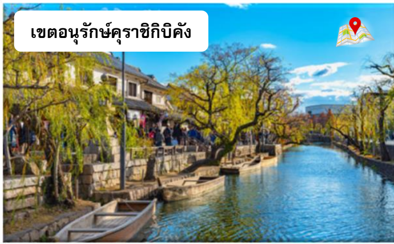
เขตอนุรักษุคราชิกิบิคัง

วัดอียามะ โฮฟุคุจิ เป็นวัดเซนที่สร้างขึ้นในปี 1232 ที่รู้จักในฐานะที่เรียนวาดภาพของ Sesshu จิตรกรชื่อดังของญี่ปุ่นที่ชำนาญการวาดภาพด้วยพู่กันจีนในวัยเด็ก ซึ่งเป็นการวาดภาพโดยใช้หมึกสีเดียวไล่เฉดสี กิจกรรมที่น่าสนใจของวัดนี้คือการนั่งสมาธิเซน ซึ่งผู้ปฏิบัติธรรมนั่งสมาธิทำให้สงบเป็นหนึ่งเดียว นักท่องเที่ยวสามารถเข้าร่วมนั่งสมาธิแบบพุทธเซนในตอนเช้าวันอาทิตย์ที่สองของทุกเดือนได้โดยไม่ต้องจองล่วงหน้า และหลังจากนั่งสมาธิจะได้ดื่มชาและชิมขนมหวาน สัมผัสประสบการณ์การต้อนรับแบบญี่ปุ่น ภาพวัดกับต้นไม้เขียวในฤดูใบไม้ผลิ หรือใบไม้แดงในฤดูใบไม้ร่วงล้วนเป็นภาพที่งดงามตรึงใจ