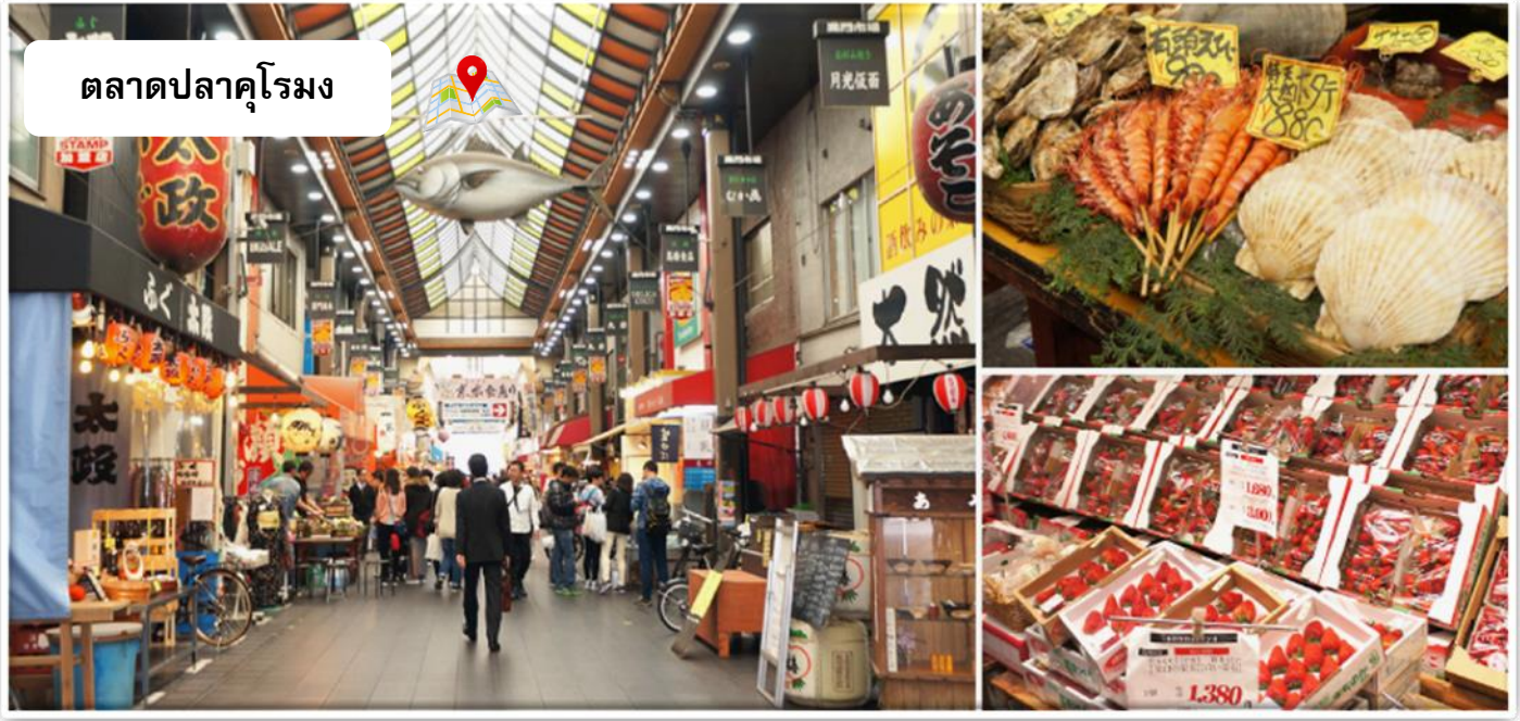
ตลาดปลาคุโรมง

นำท่านเดินทางสู่ ตลาดปลาคุโรมง เป็นตลาดที่มีชื่อเสียงและเก่าแก่มากที่สุดแห่งหนึ่งของเมืองโอซาก้า จนได้รับสมญานามว่าเป็น คริวของโอซาก้า มีบรรยากาศภายในเป็นทางเดิน Arcade เล็ก ๆ ทอดยาวประมาณ 600 เมตร 2 ข้างทางจะเต็มไปด้วยร้านค้าต่าง ๆ กว่า 160 ร้านค้า ขายทั้งของสด และแบบพร้อมทาน มีของกินเล่นและอาหารพื้นเมืองมากมายหลายชนิดให้ได้ชิมกัน ของที่ขายส่วนภายในตลาดคุโรมงจะเป็นของสด โดยเฉพาะอาหารทะเล เนื้อ และผักต่าง ๆ ร้านอาหารต่าง ๆ ภายในตลาดจึงเน้นขายอาหารทะเลกัน ทั้งแบบสด ๆ เช่น ซาซิมิ ซูชิ และหอยนางรม และแบบปรุงสุก เช่น ปลาไหลย่าง ปลาหมึกย่าง หอยเชลล์ย่าง กุ้งเทมปุระ เป็นต้น