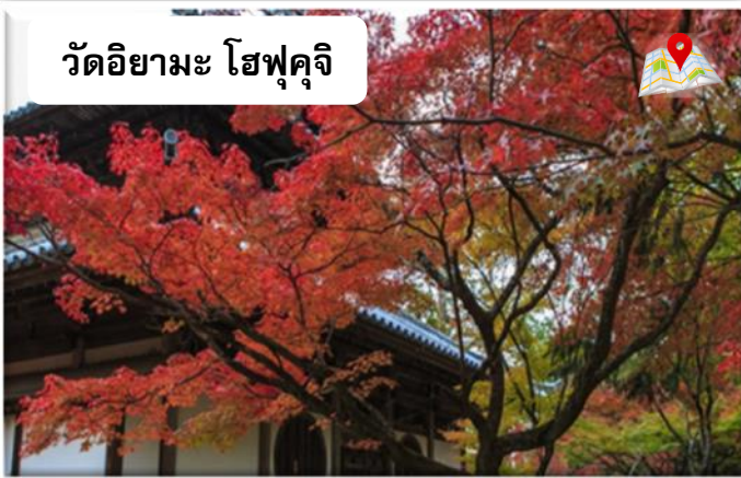
วัดอิชิมะ โฮฟุคุจิ