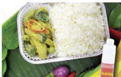
Green curry chicken with rice and water