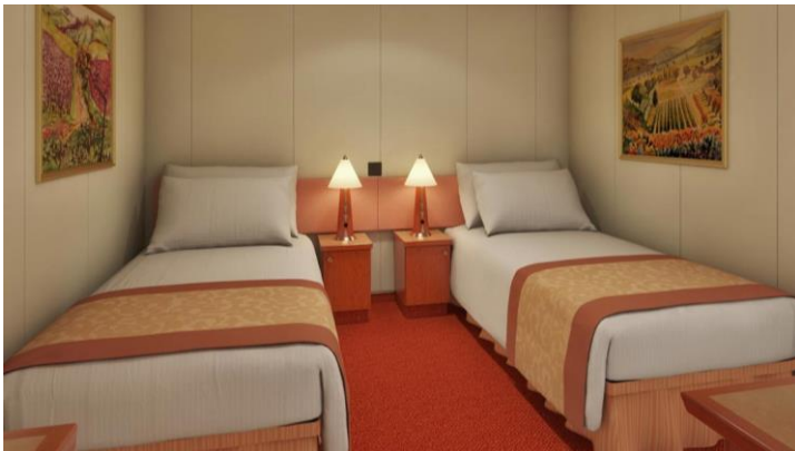
Stateroom Interior Stateroom

เราสามารถจองตั๋วเครื่องบินและที่พักเพิ่มเติมให้ท่าน รับประกันราคาถูก กรุณาติดต่อเจ้าหน้าที่