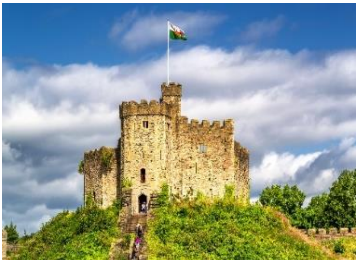
ที่สุดในอังกฤษ MOST BEAUTIFUL VILLAGE IN ENGLAND

นำท่านเดินทางสู่ หมู่บ้านไบบิวรี่ BIBURY(ระยะทาง130ก.ม.) ที่ได้รับการยกย่องว่าเป็นหมู่บ้านที่สวยงาม