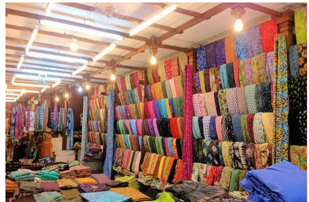
หมู่บ้านท็อปปาดิ แหล่งอุตสาหกรรมการผลิตและแพ้นท์ผ้าบาติกบาหลี