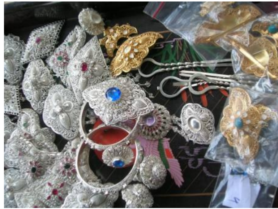
หมู่บ้านเซลุก ทำเครื่องเงินและทอง