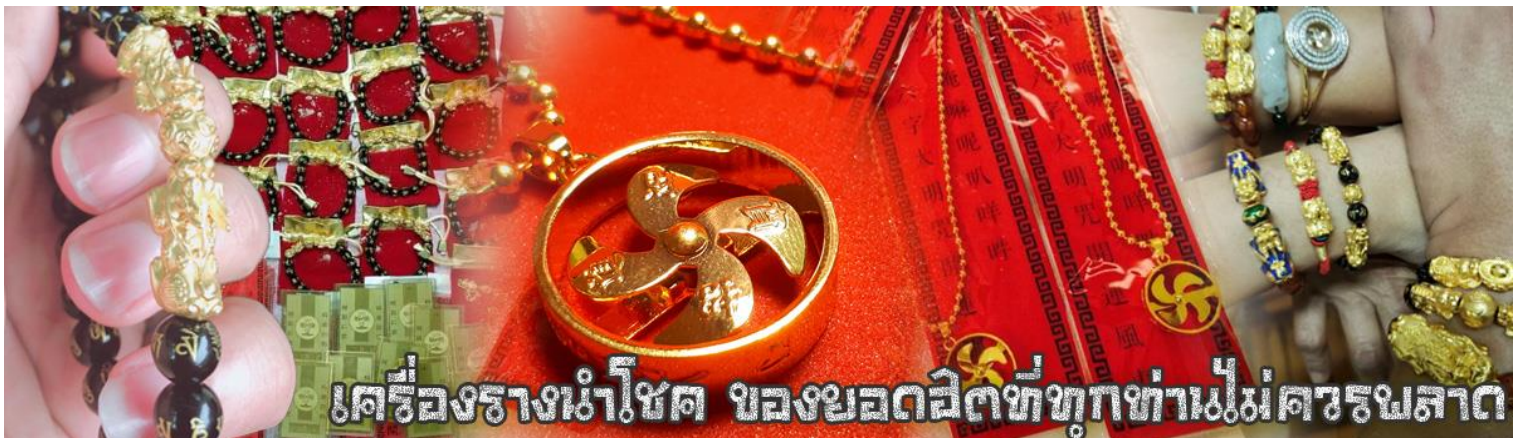
เครื่องรางนำโชค ของยอดฮิตที่ทุกท่านไม่ควรพลาด

จากนั้นนำท่านสู่ ร้านหยก ชมความงามปีเซียะ ที่เชื่อกันว่าเป็นวัตถุมงคลยอดนิยม ที่มีการนำมาบูชา เพื่อให้ช่วยป้องกันสิ่งชั่วร้ายเรียกทรัพย์สินเงินทองให้ไหลมาเทมา และกักเก็บทรัพย์นั้นไม่ให้รั่วไหลออกไปไหนได้ ชาวจีนโบราณเชื่อกันว่า ปีเซียะเป็นสัตว์ประหลาดที่รวมลักษณะของสัตว์มงคลทั้ง 5 ชนิดไว้ด้วยกัน ได้แก่ มังกร พญาราชสีห์หรือสิงโต, อินทรี, กวาง, และแมว โดยตามตำนานเล่าว่า ปีเซียะเป็นลูกมังกรตัวที่ 9 (เทพแห่งโชคลาภ) ของพญามังกรสวรรค์ มีชื่อเรียกด้วยกันหลายชื่อไม่ว่าจะเป็น “เทียนลก (กวางสวรรค์)” เป็นชื่อเต็ม ส่วนจิ้งจอกแดงจะเรียกว่า “เผ่เย้า” และคนจีนแต่จิวจะเรียกว่า “ผีชีว” และ ยังมีจำหน่ายยาสมุนไพรบำรุงเพิ่มความแข็งแรงตามความเชื่อของคนฮ่องกง