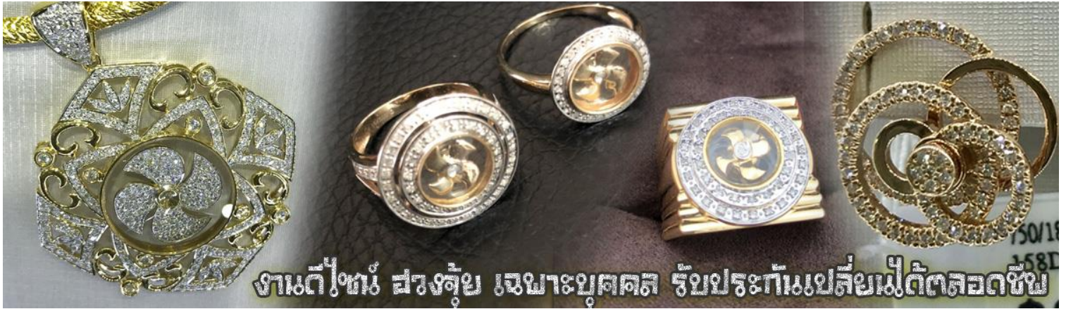
งานดีไซน์ สวยล้ำ เหมาะแก่บุคคล รับประกันเปลี่ยนไม่ตัดลดซ้ำ

นำท่านเยี่ยมชม โรงงานจิวเวลรี่ ที่ขึ้นชื่อของฮ่องกงพบกับงานดีไซน์ที่ได้รับรางวัลอันดับยอดเยี่ยม และใช้ในการเสริมดวงเรื่อง ฮวงจุ้ยนำความโชคดี มั่งมั่งแก่ผู้สวมใส่ ซึ่งในเมืองไทยก็ได้นิยมแพร่หลายออกไป ไม่กว่าจะเป็นกลุ่ม ดารา นักการเมือง พ่อค้าแม่ขายที่ประกอบธุรกิจเจ้าของกิจการห้างร้านต่างๆ ซึ่งเชื่อกันว่าจะนำสิ่งดีๆ ปิดเป่าสิ่งชั่วร้ายให้กับบุคคลที่สวมใส่ ซึ่งจะมีมากมายหลายชนิด เช่นจี้กังหัน แหวนรู้งต่างๆ นาฬิกาข้อมือ (ซึ่งผู้สวมใส่จะได้รับการดูลายมือจากซินแสประจำร้าน เพื่อแนะนำวิธีการเสริมดวงในการสวมใส่โดยไม่คิดค่าบริการ)