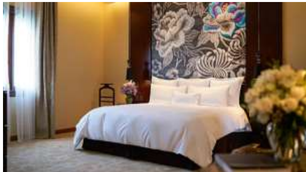
พักผ่อนตามอัธยาศัย