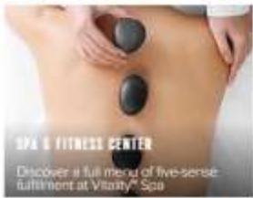
SPA & FITNESS CENTER

Discover a full menu of five-sense fulfillment at Vitality Spa.