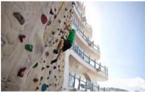
ROCK CLIMBING WALL

Rise to the occasion and take on the signature Rock Climbing Wall. From beginners to speed climbers, everyone can enjoy an unparalleled view from 40 feet above deck. Included in your fare, no reservation required.