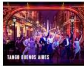
TANGO BUENOS AIRES