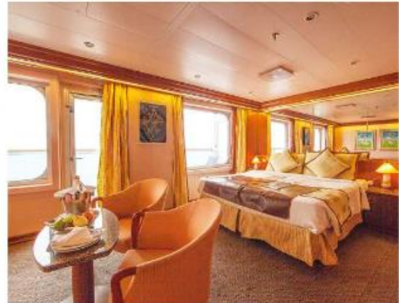
Grand Suite ♥