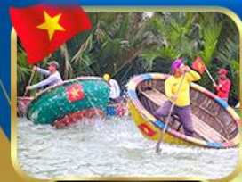
ล่องเรือกระดัว