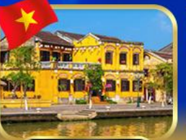
เมืองเก่าฮอยอัน