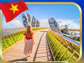
สะพานมือทองคำ