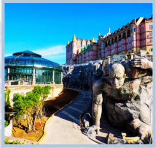
โซ่ Eclipse Square