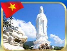
วัดหลินอิ่ง