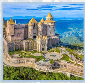
ปราสาทจันกรา