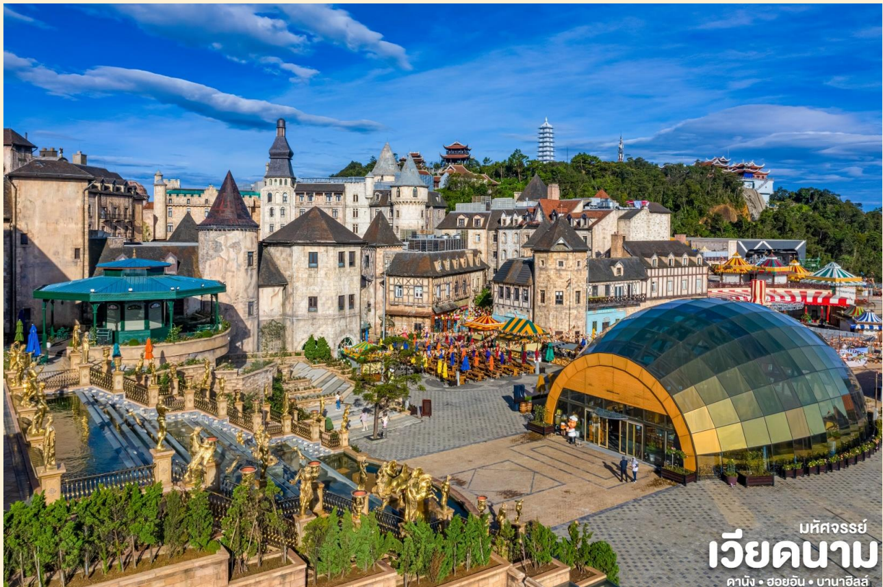
มัทศจรรย์ เวียดนาม ดานัง • ฮอยอัน • บานาฮิลล์