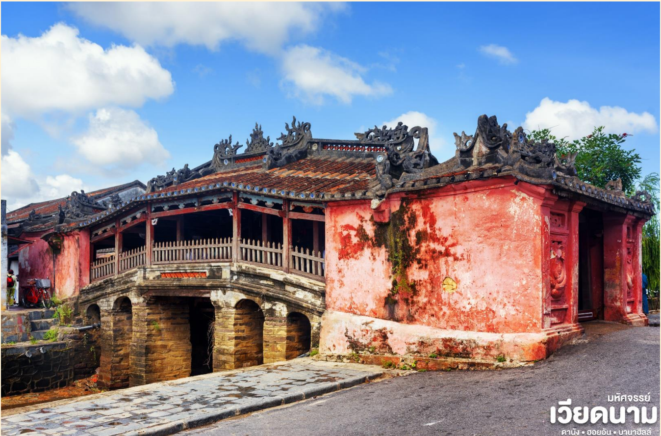
มัทศจรรย์ เวียดนาม ดานัง • ฮอยอัน • บานาฮิลล์

BT-DAD22_FD_JAN - OCT 2026 DANANG HOIAN BANAHILLS (พักบานาฮิลล์ 2 คืน)