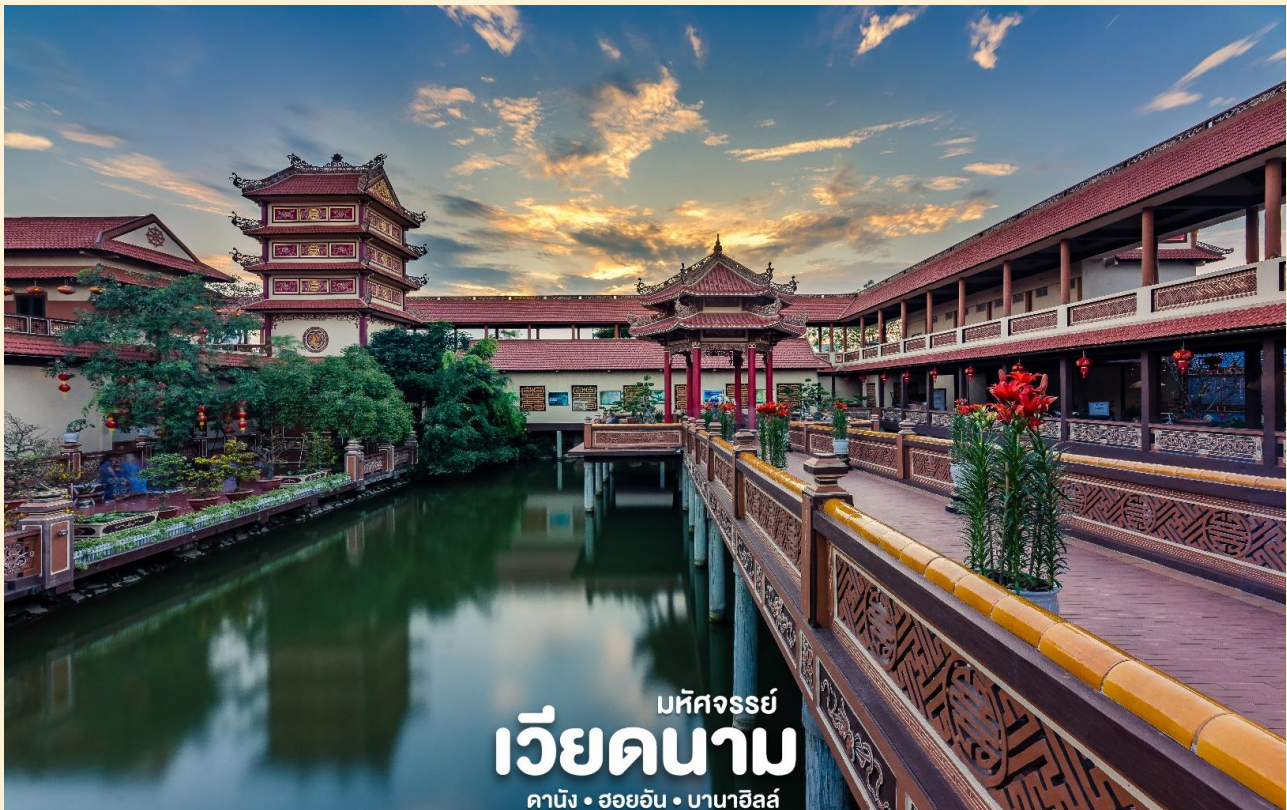
มหิศวรรษย์ เวียดนาม ดานัง • ฮอยอัน • บานาฮิลล์

จากนั้น นำท่านชม วัดนามเซิน (Nam Son Pagoda) หรือ เจดีย์นัมเซิน ถูกสร้างขึ้นในปี 1962 เจดีย์นัมเซินมีรูปแบบสถาปัตยกรรมตามแบบฉบับของเวียดนามตอนกลางดั้งเดิม เจดีย์แบ่งออกเป็นหลายพื้นที่โดยมีลักษณะเฉพาะของตัวเอง ได้แก่ ทะเลสาบฟองซัน สะพานทามทัง ศาลาวงเหียงนเหวียต อาคารเกสต์เฮาส์ ห้องโถงหลัก สะพานด่งทู เป็นต้น