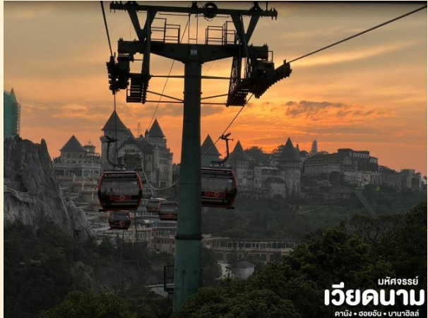
มัทศจรรย์ เวียดนาม ดานัง • ฮอยอัน • บานาฮิลล์

นั่งกระเช้าขึ้นสู่บานาฮิลล์ กระเช้าแห่งบานาฮิลล์นี้ได้รับการบันทึกสถิติโลกโดย World Record ว่าเป็นกระเช้าไฟฟ้าที่ยาวที่สุด ประเภท Non Stop โดยไม่หยุดแวะมีความยาวทั้งสิ้น 5,042 เมตร และเป็นกระเช้าที่สูงที่สุด 1,294 เมตร นักท่องเที่ยวจะได้สัมผัสบรรยากาศและบางจุดมีเมฆลอยต่ำกว่ากระเช้าพร้อมอากาศบริสุทธิ์อันสดชื่นจนทำให้ท่านอาจลืมไปเสียด้วยซ้ำว่าที่นี่ไม่ใช่ยุโรปเพราะอากาศที่หนาวเย็นเฉลี่ยตลอดทั้งปีประมาณ 10 องศาเท่านั้น