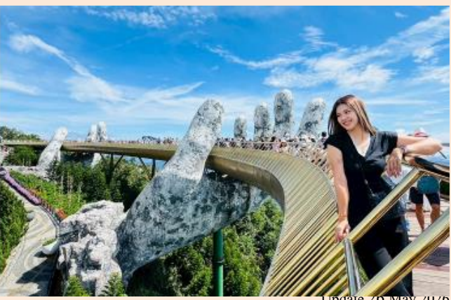
Update 26 May 2026