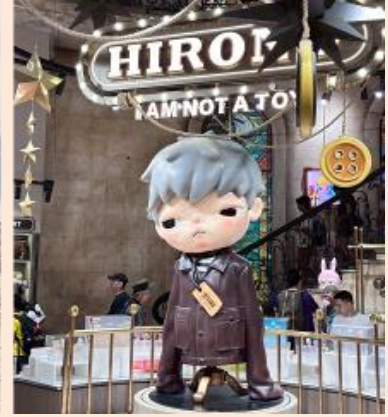
ในส่วนของสาวก ART TOY ยังสามารถแวะจุ่มที่ POP MART ได้อีกด้วย