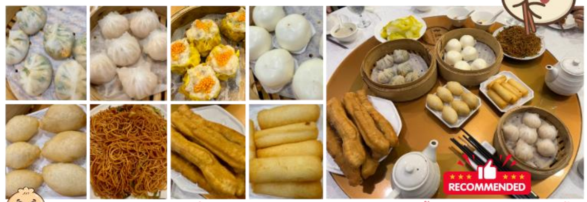
หมายเหตุ: เมนูอาจมีการเปลี่ยนแปลง โดยไม่ต้องแจ้งให้ทราบล่วงหน้า ขึ้นอยู่กับการจัดการในร้านนั้นๆ

จากนั้นนำท่านสักการะ เจ้าแม่กวนอิม ที่หาดรีพัลส์เบย์ โดยชายหาดแห่งนี้ เป็นรูปจันทร์เสี้ยว เป็นหาดที่สวยงามที่สุดในฮ่องกง เป็นแหล่งท่องเที่ยวยอดนิยมในหมู่ชาวฮ่องกง ภายในมีรูปปั้นขนาดใหญ่ของเจ้าแม่กวนอิม เจ้าแม่ทับทิม ซึ่งทำหน้าที่ปกป้องคุ้มครองชาวประมง ตั้งอยู่โดดเด่นและบริเวณใกล้เคียง โดยมีสะพาน สีแดงซึ่งเป็นสะพานต่ออายุ โดยเชื่อกันว่า ถ้าข้ามสะพาน 1 รอบ จะทำให้อายุยืนขึ้น 3 ปี (ถ้าหากข้ามกลับมาจะทำให้อายุสั้นลง 3 ปี) และการโยนเหรียญเข้าปากปลาใกล้ๆกับสะพานต่ออายุ ถ้าโยนเหรียญเข้า พรที่ขอจะสมหวัง และ สำหรับคนมีคู่ ถ้าอยากให้ชีวิตคู่ยั่งยืน แนะนำให้มานั่งระหว่างสิงห์ 2 ตัว แล้วขอพร ถ้ามากัน 2 คน ก็นั่ง 2 คน แต่ถ้ามาคนเดียวก็นั่งคนเดียว แล้วให้คิดถึงคนๆ นั้น จากนั้นก็ให้ขอพรให้อยู่ด้วยกันยาวนาน ส่วนใครที่ยังไม่มีคู่ แล้วถ้าอยากได้คู่ก็ให้มานั่งที่นี้เช่นกัน