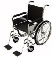
การรับบริการดูแลเป็นพิเศษ

กรณีผู้เดินทางต้องการความช่วยเหลือเป็นพิเศษ อาทิเช่น การใช้วีลแชร์ กรุณาแจ้งบริษัทฯ อย่างน้อย 7 วันก่อนการเดินทาง มิฉะนั้นบริษัทฯ จะไม่สามารถจัดการล่วงหน้าได้ เนื่องจากการขอใช้วีลแชร์ในสนามบินนั้น ต้องมีขั้นตอนในการขอล่วงหน้า และบางสายการบินอาจมีการเรียกเก็บค่าใช้จ่ายทั้งทางสนามบิน ในไทยและในต่างประเทศ ซึ่งผู้เดินทางสามารถสอบถามกับเจ้าหน้าที่ได้โดยตรงก่อนทำการจอง และหาก ในขณะของท่านมีผู้ต้องการดูแลพิเศษ เช่น ผู้ที่นั่งรถเข็น (Wheelchair), เด็ก, ผู้สูงอายุและผู้ที่มีโรค ประจำตัวหรือไม่สะดวกในการเดินทางท่องเที่ยวในระยะเวลาเกินกว่า 4 - 5 ชั่วโมงติดต่อกัน ท่านและ ครอบครัวต้องให้การดูแลสมาชิกภายในครอบครัวของท่านเอง เนื่องจากการเดินทางเป็นหมู่คณะ หัวหน้า ทัวร์มีความจำเป็นต้องดูแลคณะทัวร์ทั้งหมด