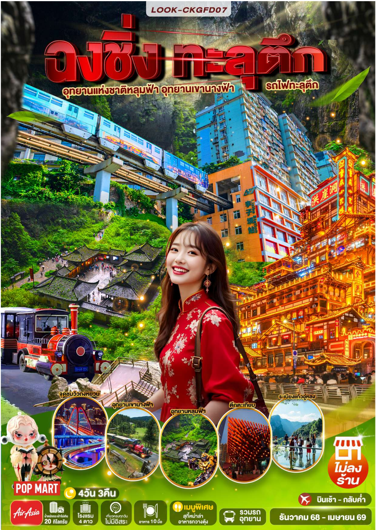
จุดชมวิวทิวทัศน์

อุทยานแห่งชาติหลุมฟ้า อุทยานเขานางฟ้า รถไฟทะลุตึก