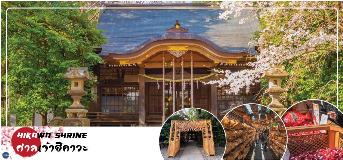
HIKAWA SHRINE ศาลเจ้าฮิคาวะ

จากนั้นนำท่านขอพรความรัก ณ ศาลเจ้าฮิคาวะ (Hikawa Shrine) (จุดชมซากุระชั้นกับภูมิอากาศ) เป็นศาลเจ้าที่เขาว่าเด็ดนัก เรื่องขอพรความรัก ภายในมี "อุโมงค์เอมะ" เอมะ คือ แพนไม้ที่เราเขียนขอพร และนำมาผูกจนกลายเป็นซุ้มคล้ายอุโมงค์ เป็นจุดที่นักท่องเที่ยวนิยมถ่ายรูปทำคอนเทนต์จำนวนมาก นอกจากนี้ สายมูไม่ควรพลาด ท่านยังสามารถซื้อเครื่องรางต่างๆ ที่ไม่ใช่เฉพาะด้านความรัก ยังมี ด้านสุขภาพ ด้านการเงิน การงาน การเรียน เดินทางปลอดภัย และโชคลาภ ก็มีมากมายให้ท่านได้เลือกไว้เป็นของฝากของที่ระลึกอีกด้วย