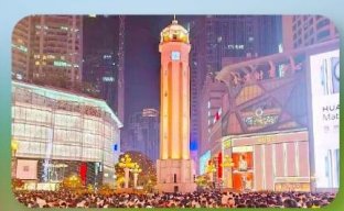
ถนนคนเดินเจียงฟางเป่ย์