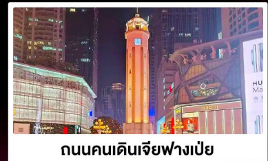
ถนนคนเดินเจียงฟางเป่ย์