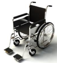
การรับบริการดูแลเป็นพิเศษ

กรณีผู้เดินทางต้องการความช่วยเหลือเป็นพิเศษ อาทิเช่น การใช้วีลแชร์ กรุณาแจ้งบริษัทฯ อย่างน้อย 7 วันก่อนการเดินทาง มิฉะนั้นบริษัทฯ จะไม่สามารถจัดการล่วงหน้าได้ เนื่องจากการขอใช้วีลแชร์ในสนาม บินนั้น ต้องมีขั้นตอนในการขอล่วงหน้า และบางสายการบินอาจมีการเรียกเก็บค่าใช้จ่ายทั้งทางสนามบินใน ไทยและในต่างประเทศ ซึ่งผู้เดินทางสามารถสอบถามกับเจ้าหน้าที่ได้โดยตรงก่อนทำการจอง และหากใน คณะของท่านมีผู้ต้องการดูแลพิเศษ เช่น ผู้ที่นั่งรถเข็น (Wheelchair), เด็ก, ผู้สูงอายุและผู้ที่มีโรคประจำตัว หรือไม่สะดวกในการเดินทางท่องเที่ยวในระยะเวลาเกินกว่า 4 - 5 ชั่วโมงติดต่อกัน ท่านและครอบครัวต้อง ให้การดูแลสมาชิกภายในครอบครัวของท่านเอง เนื่องจากการเดินทางเป็นหมู่คณะ หัวหน้าทัวร์มีความ จำเป็นต้องดูแลคณะทัวร์ทั้งหมด