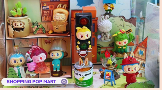
POP MART ช้อปบิงกบนานกิง