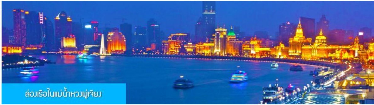
ล่องเรือใบแม่น้ำหวงผู่เกียง