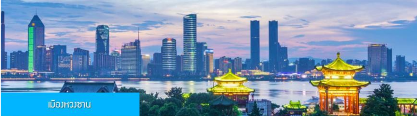
เมืองหวงซาน