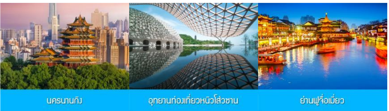
นครนานกิง