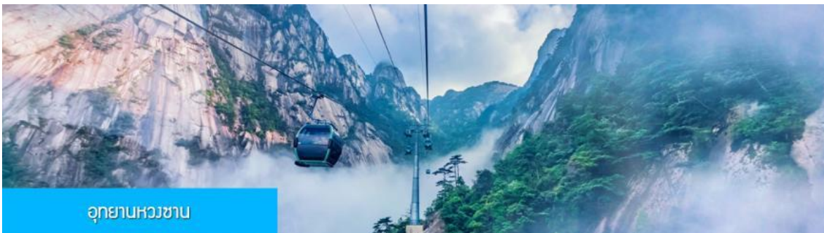
อุทยานหวงซาน