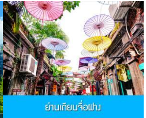
ย่านเถียนจื่อฝาง