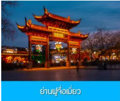
ย่านฟูจื่อเมี่ยว