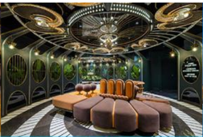
ห้องน้ำไอเทค