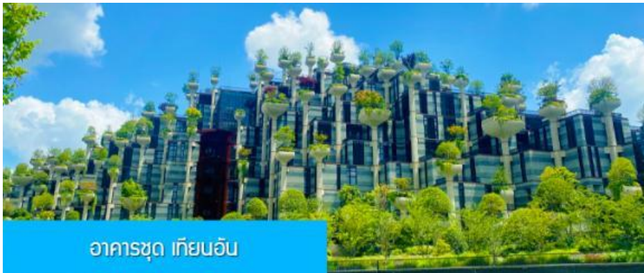
อาคารชุด เทียนอัน