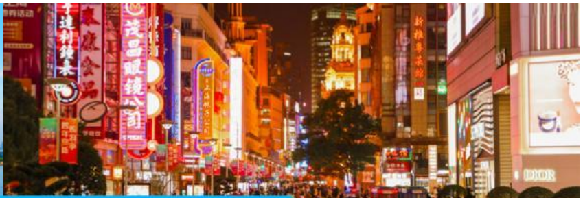
ถนนคนเดินหนานจิงอู๋

จากนั้นนำท่านเดินทางสู่ ย่านช้อปปิ้งที่ใหญ่และคึกคักที่สุดของมหานครเซี่ยงไฮ้ ถนนคนเดินหนานจิงอู๋ 南京路步行街 ให้ท่านเพลิดเพลินกับการเดินเที่ยว ชม และ ช้อปปิ้ง ชิมอาหารหรือของท่านเล่นอย่างจุใจ ในย่านถนนคนเดินนี้ นอกจากร้านค้าสินค้าแบรนด์เนมจากต่างประเทศแล้ว สินค้าแฟชั่น และสินค้าแบรนด์จีนก็มีให้เลือกอย่างมากมาย ร้านอาหารและเครื่องดื่มก็มีให้เลือกนั่งเลือกชิมมากมาย.. หรือ ตามล่าหา ลาบูบู้ ที่ร้าน POP MART ที่ใหญ่ที่สุดในเมืองเซี่ยงไฮ้