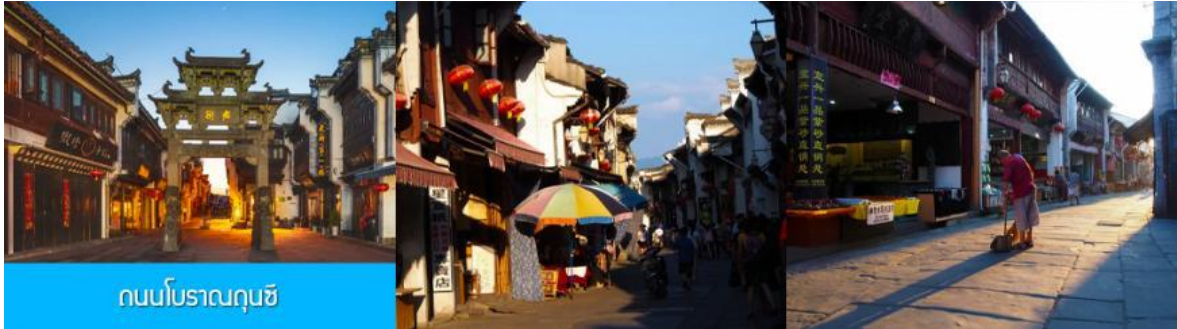
ถนนโบราณฉุนซี