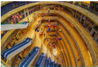
จัตุรัสเต๋อจี

พักที่ โรงแรม Holiday Inn Express Dongshan Hotel 4* หรือเทียบเท่าในนครหนานจิง