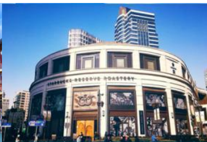
Starbuck Reserve Roastery