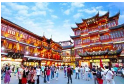
ตลาดร้อยปีฉิวหวงเมี่ยว

พักที่ โรงแรม Holiday Inn Express Hotel 4* หรือเทียบเท่าในนครเซี่ยงไฮ้