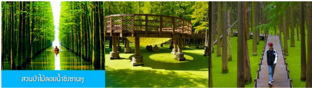
สวนป่าไม้ลอยน้ำชิงซานหู

พักที่ โรงแรม Holiday Inn Express Hotel 4* หรือเทียบเท่าในนครเซี่ยงไฮ้