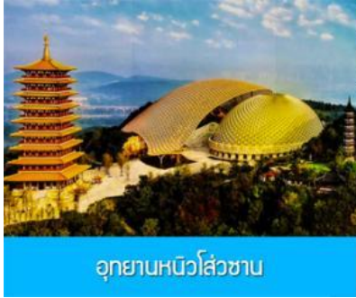
อุทยานหนิวโถ้วซาน