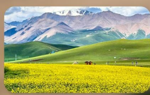
ทุ่งหญ้าซีเหลียน