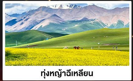
ทุ่งหญ้าฉีเหลียน