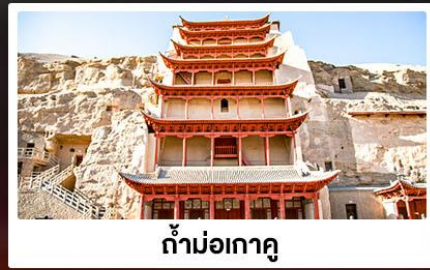
ถ้ำม่อเกาคุ