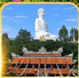
วัดลองเซิน