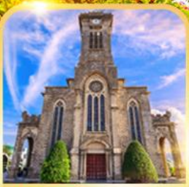
โบสถ์หินญางาง