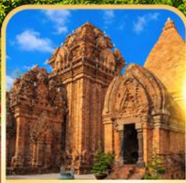
Po Nagar Cham