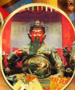
วัดกวนอู