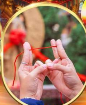
ขอพรเทพเจ้าเตี้ยแดง