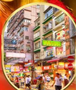
ช้อปปิ้งย่านจิมซาจุ่ย