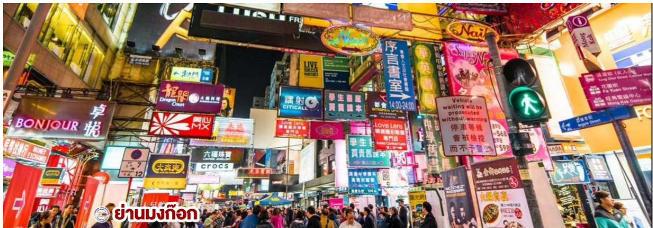
ย่านมงก๊ก

จากนั้นนำท่านช้อปปิ้ง ย่านมงก๊ก เป็นแหล่งช้อปปิ้งที่เต็มไปด้วยตรอกซอกซอยที่มีเอกลักษณ์แปลกตา รวมทั้งตลาดเก่าแก่ที่สะท้อนเสน่ห์และวิถีชีวิตของคนท้องถิ่น ถือเป็นหนึ่งiny่านยอดนิยมที่นักท่องเที่ยวทุกคนต้องแวะเวียนมา ภายในย่านมีตลาดนัด LADIES' MARKET ขนาดใหญ่ซึ่งมีร้านขายเสื้อผ้า เครื่องสำอาง รองเท้า กระเป๋า เครื่องประดับมากมาย อีกทั้งยังมีร้านอาหาร และเครื่องดื่ม ที่ขึ้นชื่อหลากหลายชนิด ให้ทุกท่านได้ลองลิ้มรสอีกมากมาย