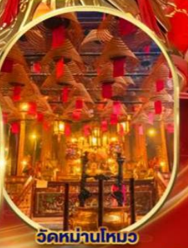
วัดหม่านใหม่