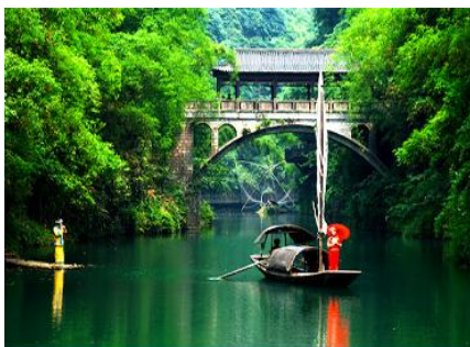
หมู่บ้านชาวนเลีย

พักที่ YICHANG HUIHAO HOTEL โรงแรมระดับ 4 ดาวหรือเทียบเท่าในเมืองหยีซาง