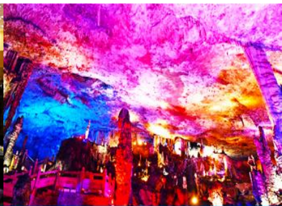
ถ้าแก้วสวรรค์จี๋วเทียนตัง