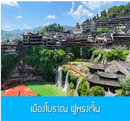
เมืองโบราณ ฝูหรงเจิน

จากนั้นนำท่านเดินทางสู่เมืองฝูหรงเจิน นำท่านเที่ยวชม เมืองโบราณ ฝูหรงเจิน 芙蓉古镇 เมืองโบราณเก่าแก่ขึ้นชื่อของมณฑลหูหนานที่โด่งดังจาก ภาพยนตร์เรื่อง ฝูหรงเจิน เป็นสถานที่ท่องเที่ยวระดับ 4A ที่ได้รับความนิยมจากนักท่องเที่ยวคู่กับเมืองโบราณฟงหวง เป็นสถานที่หลักในการถ่ายทำภาพยนตร์เรื่อง ฝูหรงเจิน ทำให้สถานที่แห่งนี้ยังได้รับความนิยมจากนักท่องเที่ยว จุดไฮไลท์ของเมืองโบราณแห่งนี้ นอกจากบ้านเรือนโบราณสวยเก๋ที่เป็นเอกลักษณ์เฉพาะของมณฑลหูหนาน ที่นี่ยังมีน้ำตกขนาดใหญ่ที่สวยงามกลางเมืองที่เป็นจุดเช็คอิน