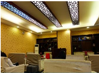
ศูนย์แพคเกจจีน

อัตราค่าบริการสำหรับโปรแกรมเสริมการแสดงชุด The love Story of Wooden man and Fairy Fox ท่านละ 400 หยวน (หรือ ประมาณ 2000.-บาทขึ้นอยู่กับอัตราแลกเปลี่ยน) ระยะเวลาที่ใช้ในการเที่ยวชมการแสดง ประมาณ 3 ชั่วโมง รวมเวลาเดินทางไป กลับค่าบริการรวม ค่าบัตรเข้าชม ค่ารถรับ ส่ง และค่าน้ำเที่ยวของไกด์ท้องถิ่น