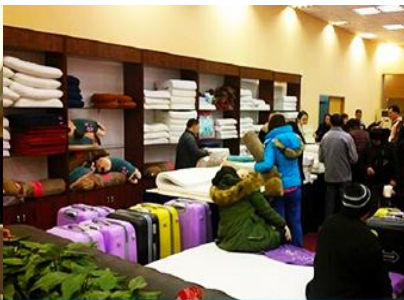
ศูนย์จำหน่ายผลิตภัณฑ์ทางพาธา