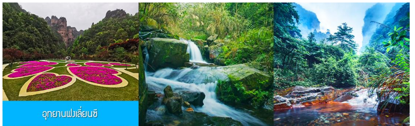
อุทยานฟงเหลียนซี