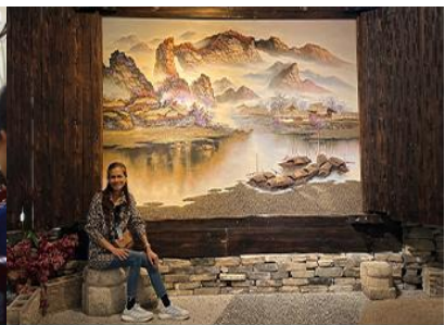
พิพิธภัณฑ์ภาพถ่ายจีนฮินทราย

วันที่ 1 เมืองจางเจียเจีย- ศูนย์ผลิตภัณฑ์หยก –ร้านใบชา – พิพิธภัณฑ์ภาพถ่ายจีนฮินทราย-ไกด์นำเสนอบริการเสริม สะพานกระจกแกรนด์แคนยอน- เมืองหยีซาง