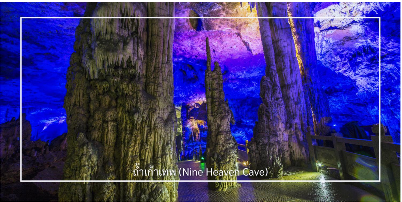
ถ้ำเก้าเทพ (Nine Heaven Cave)