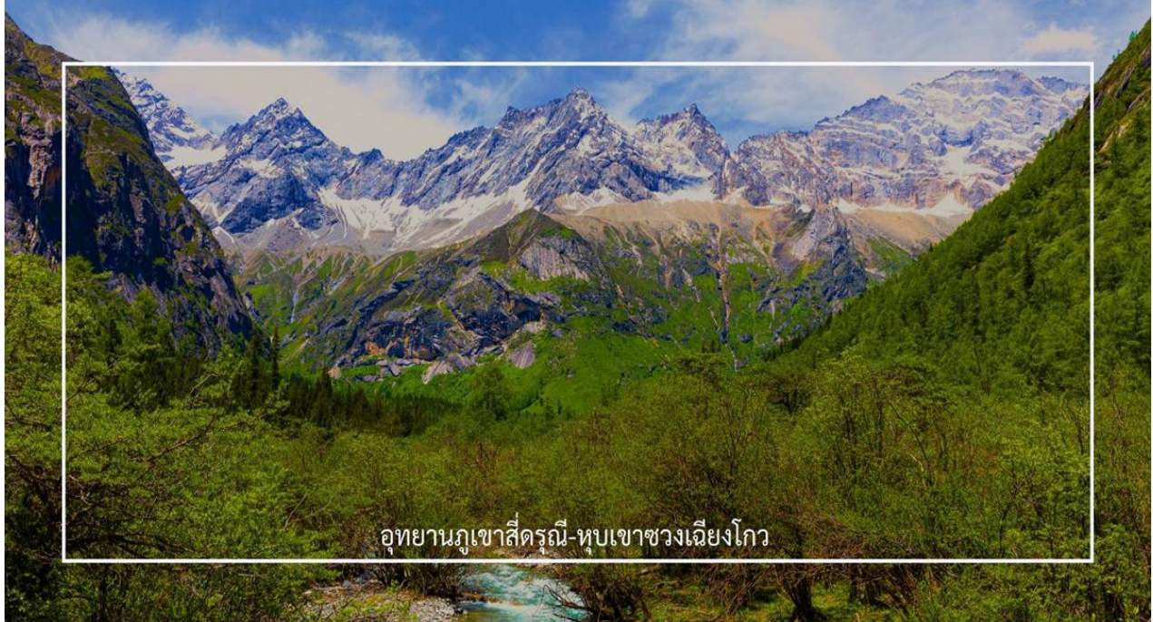
อุทยานภูเขาสี่ดรุณี-หุบเขาซวงเฉียวโกว

นำท่านชมเส้นทางไฮไลท์ หุบเขาซวงเฉียวโกว (Shuangqiaogou Valley) (รวมรถอุทยาน) เป็นหนึ่งในสถานที่ท่องเที่ยวที่สวยงามที่สุดของอุทยานภูเขาสี่ดรุณี เดินทางง่ายและสะดวกที่สุด เราจะเดินทางเข้าไปยังจุดที่ลึกที่สุด และค่อย ๆ นั่งรถเที่ยวออกมาตามจุดต่าง ๆ เส้นทางนี้รวมจุดสำคัญหลายอย่างไว้ด้วยกัน ทั้งภูเขาที่สูงตระหง่านและปกคลุมไปด้วยหิมะในฤดูหนาว พุ่มหญ้าเขียวขจีในฤดูใบไม้ผลิและฤดูร้อน หรือเห็นธารน้ำแข็งและทะเลสาบต่างๆ ทำให้คุณได้สัมผัสกับความงดงามของธรรมชาติในทุกฤดูกาลได้แบบ 360 องศา