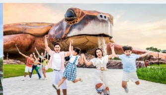
วินเพิร์ล อควาเรียม

*ทางบริษัทฯ ขอสงวนสิทธิ์ในการสลับโปรแกรมทัวร์ตามความเหมาะสมขึ้นอยู่กับสถานการณ์หน้างาน โดยคำนึงถึงผลประโยชน์ของลูกค้าเป็นสำคัญ