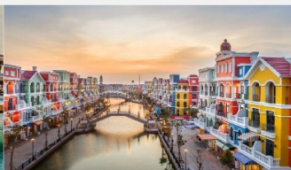
แกรนด์เวิลด์ฟู้ท๊วก