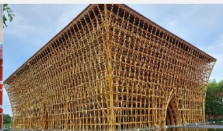
บ้านไม้ไผ่