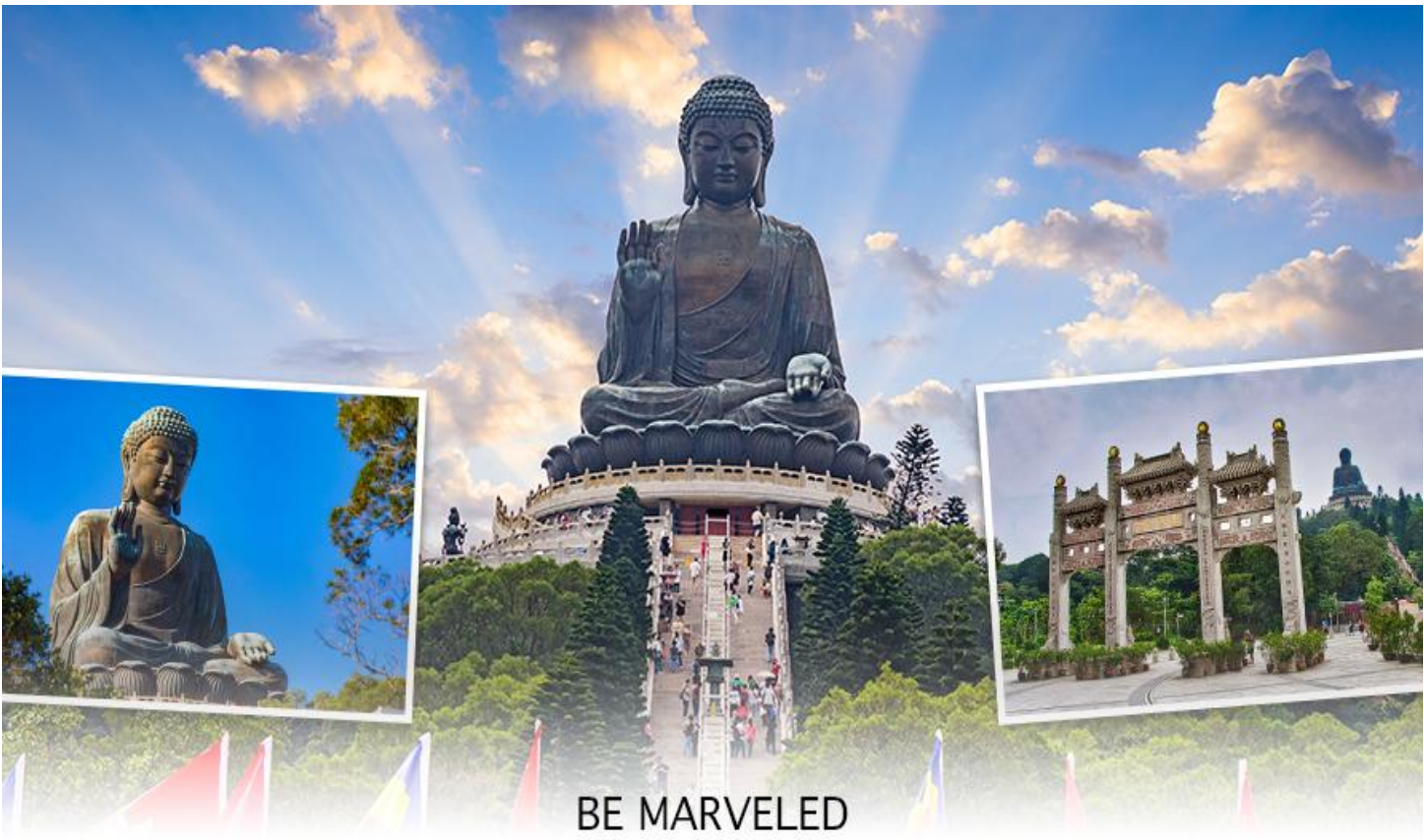
BE MARVELED พระใหญ่เทียนถาน

☉ อีศระอาหารเย็น เพื่อความสะดวกในการขอปิ้ง