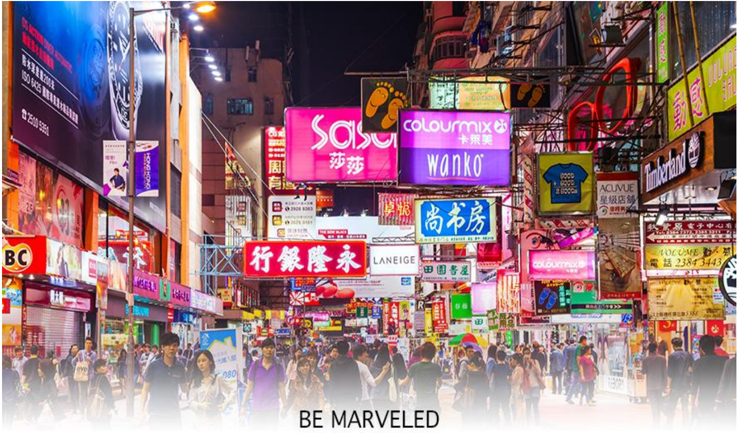
BE MARVELED TSIM SHA TSUI

เย็น 10:00 อาหารเช้าเย็น เพื่อความสะดวกในการช้อปปิ้ง