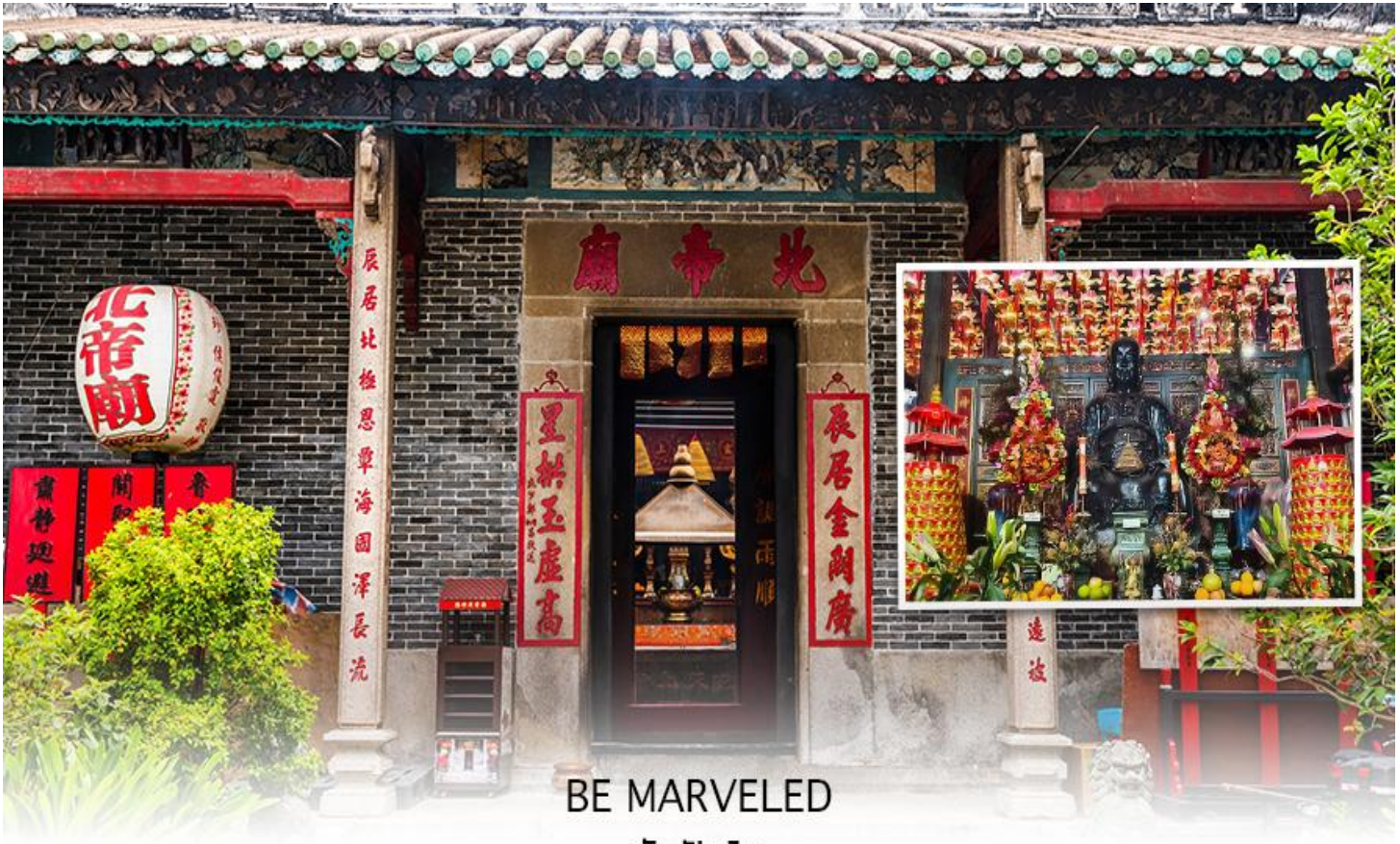
BE MARVELED วัดปกไต่

จากนั้นนำท่าน ช้อปปิ้ง ย่านจิมซาจุ่ย เป็นแหล่งช้อปปิ้งชื่อดัง มีร้านขายของทั้งเครื่องหนัง, เครื่องกีฬา, เครื่องใช้ไฟฟ้า, กล้องถ่ายรูป, อุปกรณ์อิเล็กทรอนิกส์และสินค้าแบบที่เป็นของพื้นเมืองฮ่องกงอยู่ด้วย อีกทั้งสินค้า แบรินด์เนม รวมถึงร้านอาหาร ตั้งอยู่บนถนนนาธาน ถนนทอดยาวตั้งแต่จิมซาจุ่ย จนถึงย่านปรีนซ์เอ็ดเวิร์ด เต็มไปด้วยร้านค้าต่างๆมากมาย ทั้งเสื้อผ้าแบรนด์เนมระดับ HI-END ชื่อดังทั่วโลก ห้างสรรพสินค้าที่ทันสมัย จากถนน นาธานไปที่ถนนแคนตัน ท่านจะตื่นตาตื่นใจไปกับเอาต์เล็ตแบรนด์ที่เรียงติดกันเป็นแถบ นอกจากนี้ยังมี HARBOUR CITY ศูนย์การค้ายักษ์ใหญ่ของฮ่องกง ซึ่งมีร้านค้ากว่า 450 ร้านรวมอยู่ที่นี้ และมี SHOPPING COMPLEX ขนาดใหญ่ชื่อ OCEAN TERMINAL ซึ่งประกอบไปด้วยห้างสรรพสินค้า เรียงรายกันอยู่ และมีทางเชื่อม ติดต่อกันสามารถเดินทะลุถึงกันได้ มีสินค้าแบรนด์ดัง ไม่ว่าจะเป็น GIORDANO, BOSSINI, COACH, LONGCHAMP, LOUIS VUITTON, PRADA, HEMES และอีกมากมายให้ท่าน ได้เลือกซื้อ