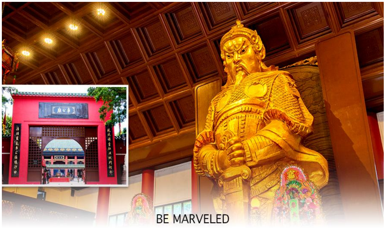
BE MARVELED วัดแชกง

นำท่านเดินทางสู่ วัดแชกงหมิว หรืออีกชื่อหนึ่งว่า “วัดกังหันลม” โดยมีสัญลักษณ์เป็นกังหันนำโชค สร้างขึ้น เพื่อรำลึกถึงท่านแชกงองค์เก่าแก่ มีอายุกว่า 300 ปี ตั้งอยู่ในเขต SHATIN ให้ท่านได้จุ้รูปขอพร สักการะ เทพเจ้า แชกง เป็นอีกหนึ่งวัดที่มีประวัติศาสตร์อันยาวนาน มีตามตำนานเล่ากันว่า ได้มีโจรสลัดต้องการที่จะมาปล้นชาวบ้าน เมื่อนายพลแชกงรู้เข้าก็ได้บอกให้ชาวบ้านปักกังหันลมแล้วนำไปติดไว้ที่หน้าบ้าน ปรากฏว่าโจรสลัดได้จากไปและไม่ได้ ทำการปล้น ชาวบ้านจึงมีความเชื่อว่ากังหันลมนั้นช่วยจัดสิ่งชั่วร้ายที่กำลังจะเข้ามา และนำพาสิ่งดีๆ มาสู่ตน จึงได้ สร้างวัดแชกงแห่งนี้ขึ้น เพื่อระลึกถึงนายพลแชกง และเป็นที่สักการะบูชาเพื่อไม่ให้มีสิ่งไม่ดีเกิดขึ้น โดยจะมีวิธีการไหว้ คือ ตั้งจิตอธิษฐานด้านหน้าองค์เจ้าพ่อแชกง จากนั้นให้ท่านหมุนกังหัน จะมีกังหัน 4 ใบพัด แต่ละใบหมายถึงพร 4 ประการ คือ เดินทางปลอดภัย, สุขภาพแข็งแรง, สมความปรารถนา, และ โชคลาภเงินทอง เชื่อกันว่าหากหมุนครบ 3 รอบและตีกลอง 3 ครั้ง ถือว่าเป็นการช่วยหมุนปัดเป่าเอาสิ่งร้ายและไม่ดีออกไปให้หมด และนำพาสิ่งดีๆ เข้ามาแทน