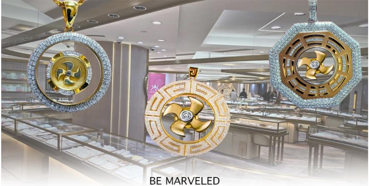
BE MARVELED ศูนย์ฮวงจุ้ย กัณฑ์เศรษฐี

ว่าหยก มงคล ถ้าพกติดตัวไว้จะอายุยืนและสุขภาพดีมีสินค้ำมากมายเกี่ยวกับหยก อาทิ กำไลหยก หรือสัตว์นำโชคอย่างปีเซี่ยะ ให้ท่านได้เลือกซื้อเป็นของฝาก, ของที่ระลึก หรือของนำโชคแต่ตัวท่านเอง