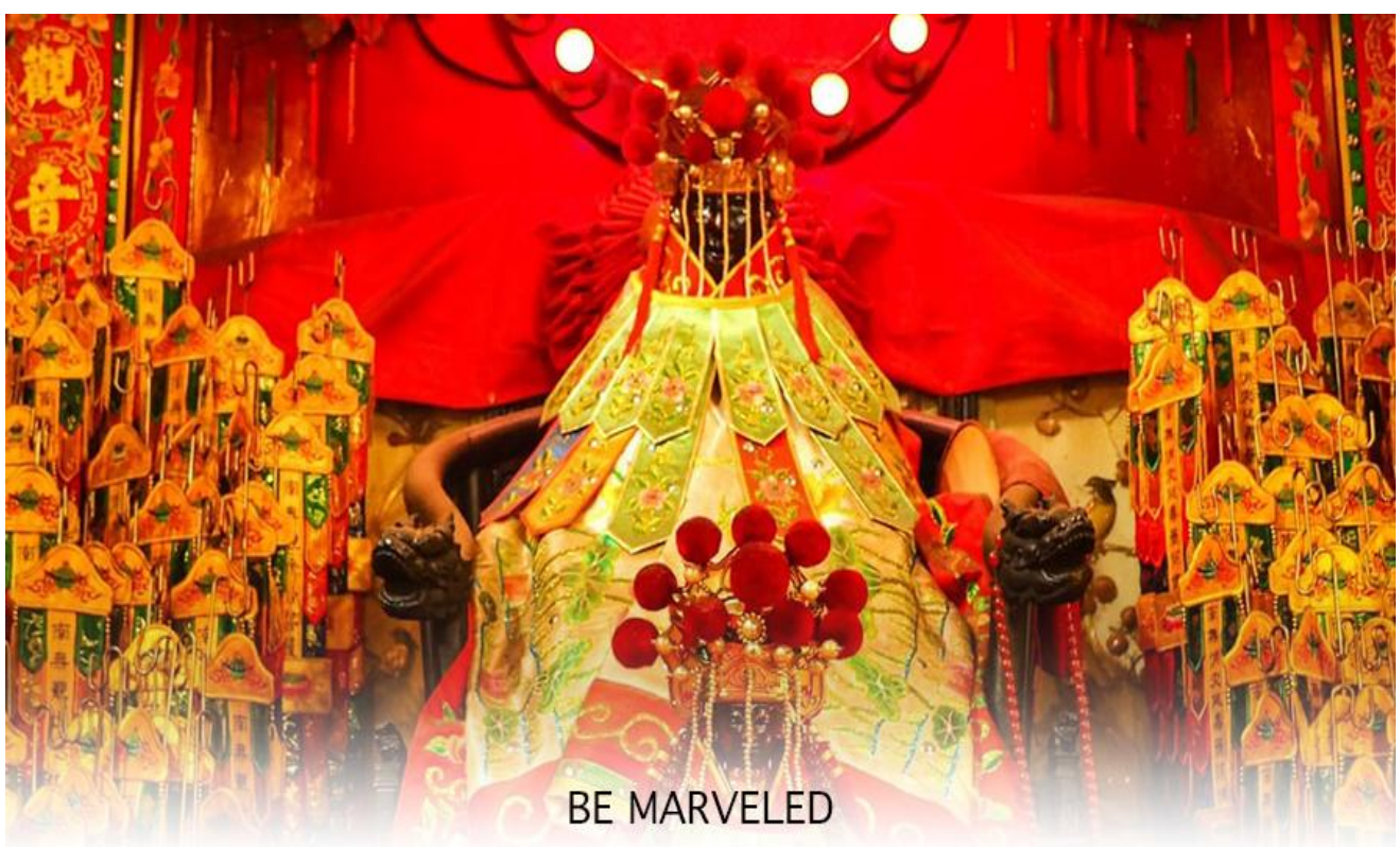
BE MARVELED วัดเจ้าแม่กวนอิมสองอำ (ยิมวิน)

หลังจากนั้น นำทุกท่านเดินทางไปยัง (เจ้าแม่กวนอิม วัดสองอำ (HUNG HOM KWUN YUM TEMPLE) เป็นหนึ่งในวัดที่เก่าแก่ที่สุดของฮ่องกง และชาวฮ่องกงเลื่อมใสกันมาก สร้างขึ้นในปี ค.ศ.1873 ในสมัยช่วงสงครามโลกครั้งที่ 2 มีการปล่อยระเบิดลงบริเวณใกล้เคียงกับวัดแห่งนี้หลายต่อหลายครั้ง ทำให้มีผู้บาดเจ็บและล้มตายมากมาย แต่ชาวบ้านที่หนีเข้าไปหลบภัยในวัดนี้กลับปลอดภัยอย่างปาฏิหาริย์ และตัววัดก็ไม่ได้ได้รับความเสียหายจากเหตุการณ์ทิ้งระเบิดอย่างน่าอัศจรรย์ ตามความเชื่อของคนจีนในฮ่องกง-มาเก๊า จะมี "วันเปิดทรัพย์" หรือ "พิธียืมเงิน เจ้าแม่กวนอิมฮ่องกง" เป็นวันที่จะมาขอพรและยืมเงินเจ้าแม่กวนอิมซึ่งนับจากหลังวันตรุษจีน ไป 26 วัน จะเป็นวันเปิดทรัพย์ที่จัดขึ้นในทุกปี พิธีนี้จะมีเพียงครั้งปีละครั้งเท่านั้น เป็นวันสำคัญอีกวันที่คนหลังไหลมาไหว้ขอพรอย่างไม่ขาดสาย