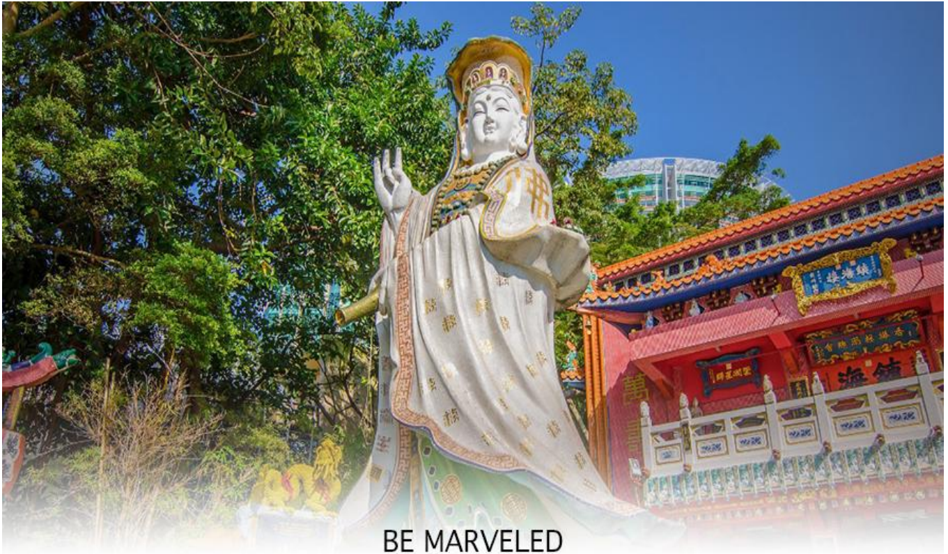
BE MARVELED วัดเจ้าแม่กวนอิมริปลัสเบย์

จากนั้นนำท่านเดินทางสู่ วัดหลินฟ้า (LIN FA KUNG TEMPLE) วัดหลินฟ้ากงอยู่ในย่านหว่านไฉ้ ตั้งอยู่บนเนินเขาหันหน้าออกสู่ทะเลทางทิศตะวันออกเฉียงใต้ของอ่าวคอสเวย์ ถึงแม้จะเป็นวัดเล็ก ๆ แต่วัดหลินฟ้า ก็วัดเก่าแก่ที่มีประวัติความเป็นมาเกี่ยวข้องกับความสัมพันธ์ของเจ้าแม่กวนอิมโดยตรงวัดนี้ตั้งอยู่บนถนนลิลี สตรีท (Lily St.) ที่เชื่อมต่อกับถนน Lin Fa Kung ตามชื่อวัดหลินฟ้า ตำนานเล่าว่า ในสมัยราชวงศ์ซิง เจ้าแม่กวนอิม หรือพระโพธิสัตว์กวนอิม ซึ่งเป็นเทพีแห่งความเมตตา ได้ปรากฏกายขึ้นบนโขดหินรูปดอกบัว (Lotus Rock) ณ บริเวณที่ตั้งของวัดในปัจจุบัน ชาวบ้านเชื่อว่าการปรากฏกายของเจ้าแม่กวนอิมเป็นสัญลักษณ์ของความโชคดีและการคุ้มครองจากภัยพิบัติต่างๆ จากจุดนี้ เราสามารถเดินเล่นเดินเที่ยวต่อไปยังถนนเส้นอื่น ๆ ได้ง่าย ตลอดเส้นทาง ทำให้วัดหลินฟ้า หรือ หลินฟ้ากง (Lin Fa Kung) แห่งนี้ อยู่ในจุดที่นักท่องเที่ยวสามารถเข้ามาไหว้ขอพรเจ้าแม่กวนอิมวังดอกบัวได้สะดวก