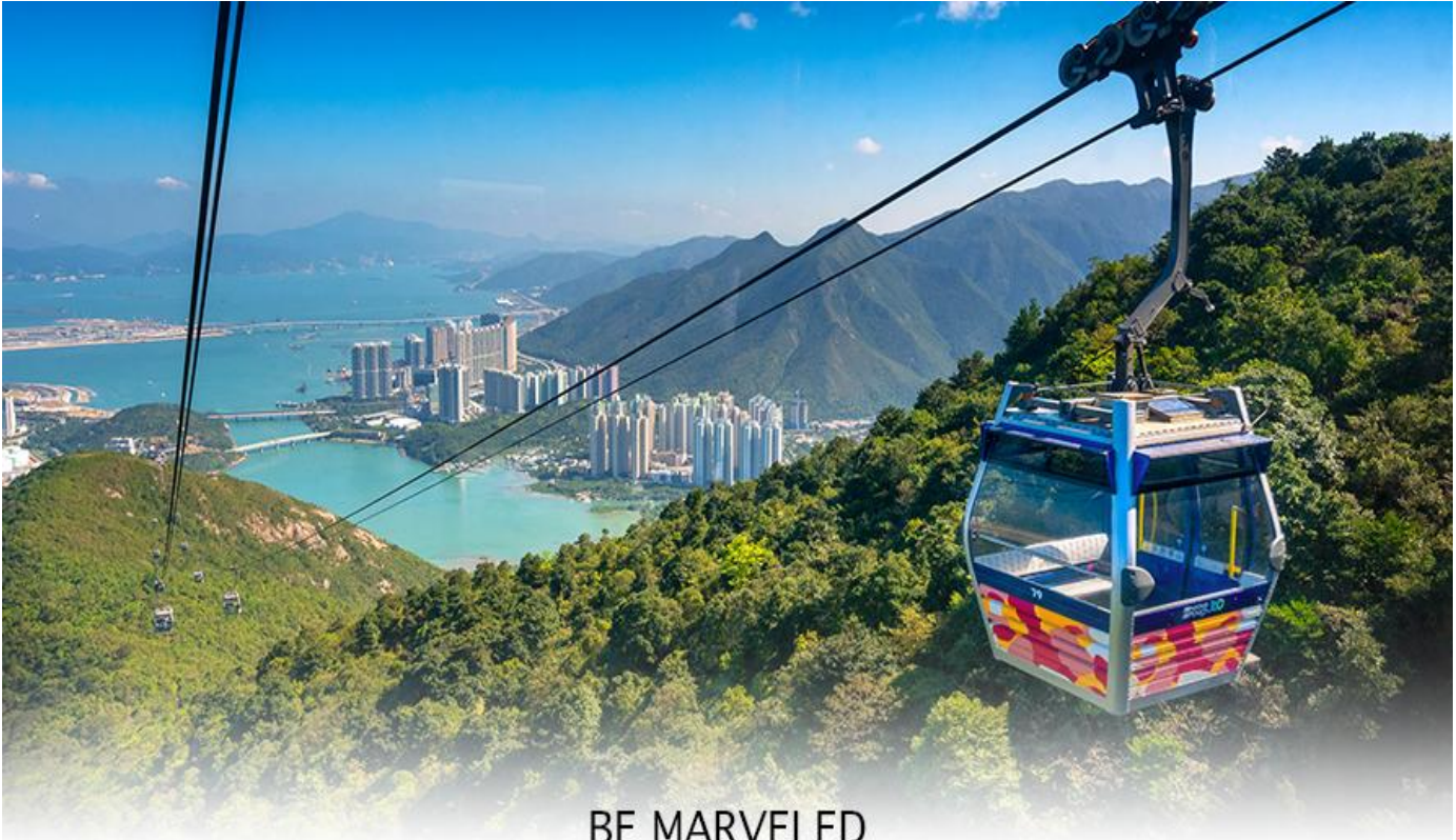
BE MARVELED กระเช้านองปิง

ล่าง ซึ่งการเดินทางขึ้นไปสักการะองค์พระใหญ่อย่างใกล้ชิดนั้น ต้องเดินขึ้นบันได จำนวน 268 ขั้นและได้รับเลือกให้เป็นสิ่งมหัศจรรย์ทางวิศวกรรมขั้นที่ 4 จากทั้งหมด 10 ชั้นของฮ่องกงในปี ค.ศ. 2000 ถือเป็นพระพุทธรูปองค์ใหญ่ที่เป็นสุดยอดของประติมากรรมทางพุทธศาสนาที่มีการผสมผสานระหว่างศิลปะสำริดแบบดั้งเดิมกับเทคโนโลยีสมัยใหม่ ชาวฮ่องกงเชื่อว่า หากใครได้มานมัสการขอพรองค์พระใหญ่แห่งนี้แล้ว ชีวิตก็จะมีแต่ความโชคดี มีความสุขสมหวัง และประสบความสำเร็จในทุกๆ ด้าน หลังจากไ้พระแล้วท่านสามารถเลือกซื้อของฝาก, ของที่ระลึก จากหมู่บ้านนองปิง อาทิเช่น หยก ไข่มุก หรือเครื่องประดับคริสตัล เพื่อเป็นของที่ระลึก จากนั้นนั่งกระเช้ากลับลงมายังสถานีตุงซุง