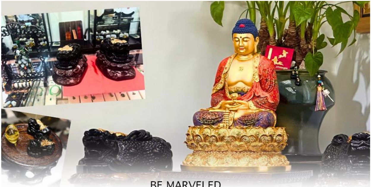
BE MARVELED ศูนย์ปีเซี่ยะ