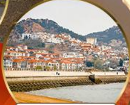
ซาจื่อโข่ว