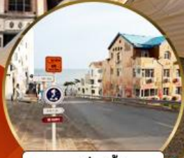
ถนนฮ้างวีป่า