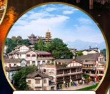
เมืองโบราณฉือจี้โข่ว