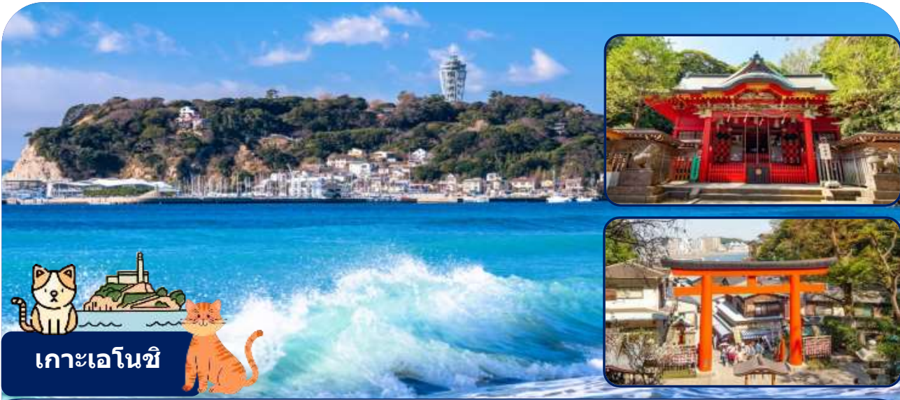
เกาะเอโนชิ

นำท่านเดินทางสู่เมืองคามาคุระ จังหวัดคางาวะ เมืองประวัติศาสตร์ที่ขึ้นชื่อเรื่องวัดวาอารามและวิวทะเลสุดโรแมนติก ให้ท่านได้สัมผัสกลิ่นอายญี่ปุ่นแบบดั้งเดิมผสมผสานกับความสงบของธรรมชาติ