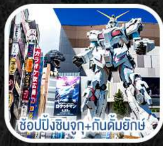
ช้อปปิ้งชินจูกุ+กินคิมยักซ์